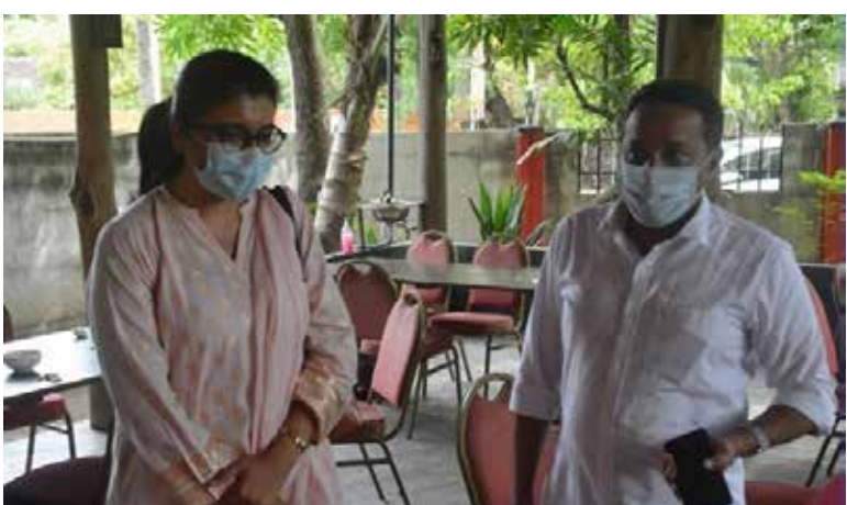
முஸ்லிம், கிறிஸ்தவ மக்களுக்குமிடையே உள்ள நட்பு, சகோதரத்துவம் தொடர்பில் விளக்கமளித்த பாகிஸ்தானிய