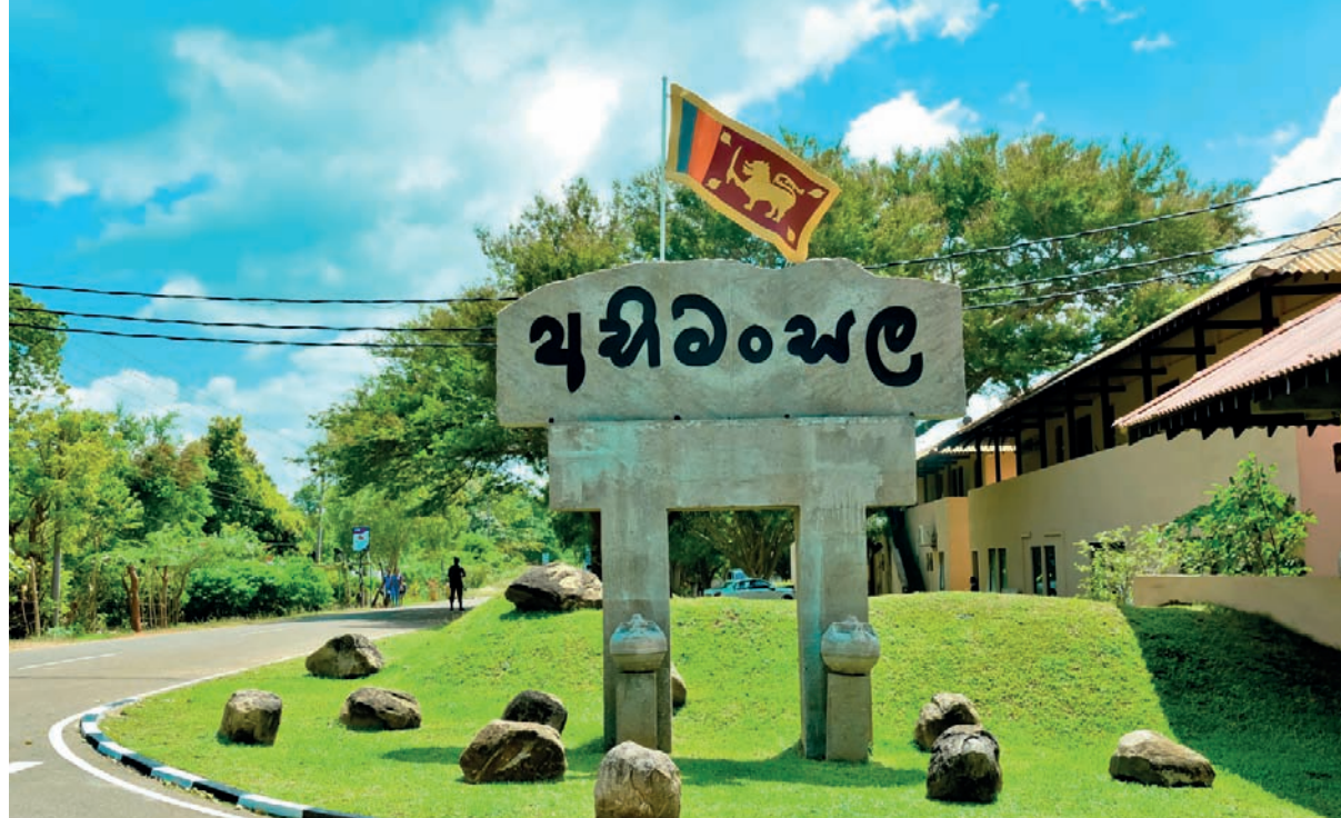
37 ஆவது ஆண்டுல் தடம் பதிக்கும்