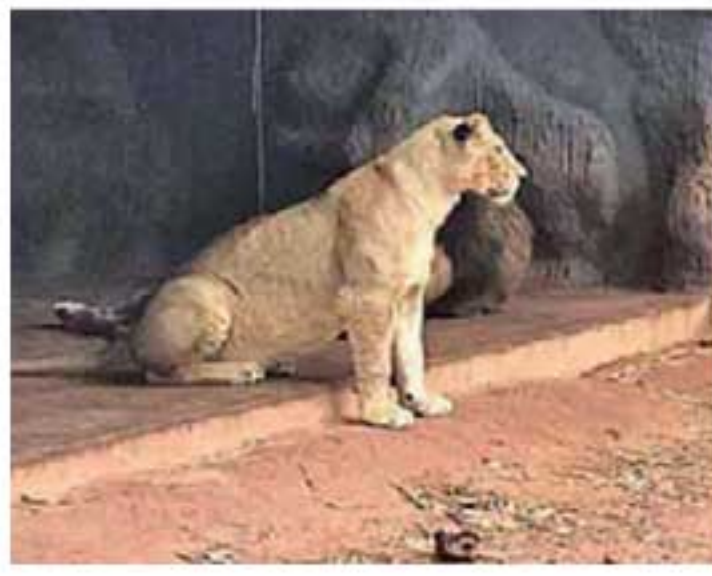
மிருகக்காட்சி சாலையில் ஏனைய விலங்குகளுக்கு மேற்கொள்ளப்பட்ட பரிசோதனைகளில், அந்த விலங்குகளுக்கு