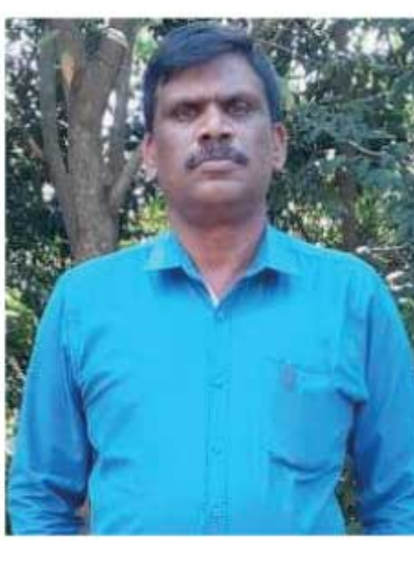
ஆசிரியர் சங்கத்தின் உறுப்பினர்கள் பலரும் தனிமைப்படுத்தல் நிலையத்துக்கு அனுப்பி

வைக்கப்பட்டனர். இதற்கு எதிர்ப்புத் தெரிவித்து, இணையத்தள கற்பித்தல் நடவடிக்கைகளிலிருந்து ஆசிரியர்கள் வெளியேறினர். இந்தப் பணிப் பகிஷ்கரிப்பு, நான்காவது நாளைக்கும் முன்னெடுக்கப்பட்டு வருகின்ற நிலையில், எமக்கு நியாயமான முடிவு கிடைக்கும் வரை, எமது போராட்டம் தொடரும் எனவும் அவர் மேலும் தெரிவித்துள்ளார்.