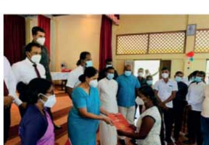
கோமரங்கடவெல மத்திய மகா வித்தியாலயக் கேட்போர்