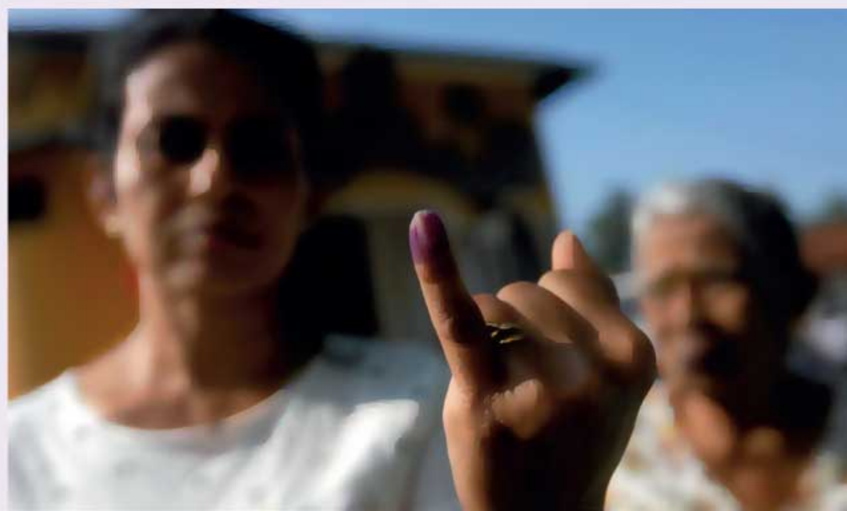
தொகையில் திருத்தங்கள் மேற்கொள்ளப்படவுள்ளன. தேர்தல்களில் களமிறங்கும் சயாதீன வேட்பாளர்கள் மாத்திரம், கட்டுப்பணம் செலுத்த வேண்டுமென்ற நடைமுறையே

அ த்தியாவசிமற்ற வகையில் வேட்பாளர்கள், தேர்தல்களில் போட்டியிடுவதைத் தவிர்க்கும் வகையில், தேர்தல்களில் போட்டியிடும் போது, வேட்பாளர் செலுத்தவேண்டிய கட்டுப்பணத் தொகையில் திருத்தங்கள் மேற்கொள்ளப்படவுள்ளன. இதற்கான அமைச்சரவைப் பத்திரமும் ஜனாதிபதியால் சமர்ப்பிக்கப்பட்டதாக அறியமுடிகின்றது. இதனடிப்படையில், ஜனாதிபதித் தேர்தல், பொதுத் தேர்தல், மாகாண சபைத் தேர்தல் உள்ளிட்ட அனைத்துத் தேர்தல்களிலும் செலுத்தவேண்டிய கட்டுப்பணத் தொகையில் திருத்தங்கள் மேற்கொள்ளப்படவுள்ளன. தேர்தல்களில் களமிறங்கும்