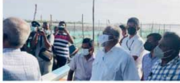
முடியாது. நியாயமான கருத்துகள் இருக்குமாயின் அவை பரிசீலிக்கப்படும் என்றார்.

கௌதாரிமுனை கலஸ்டை குஞ்சு வளர்ப்பு நிலையம் பெரும் சர்ச்சையை ஏற்படுத்திந்த நிலையில், அந்நிலையத்தை பார்வையிட்ட கடற்றொழில் அமைச்சர் டக்ளஸ் தேவானந்தா, வெற்றுப் பூச்சாண்டிகளால் மக்களுக்கு நன்மைகளை ஏற்படுத்தக்கூடிய திட்டங்களைத் தடுத்து நிறுத்த