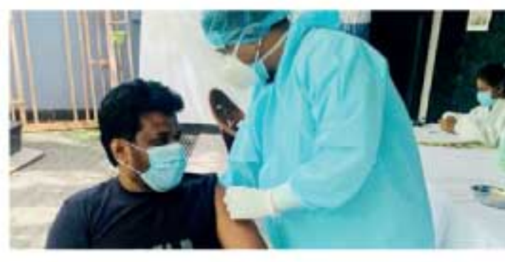
செலுத்திக்கொண்டார். பாராளுமன்ற உறுப்பினர்களுக்கும்

ஜே. வி. பியின் தலைவரான பாராளுமன்ற உறுப்பினர் அநுரகுமார திலாநாயக்க, கொவிட்-19 தடுப்பூசியை, நேற்று (14) ஏற்றிக்கொண்டார். கொழும்பு, பௌத்தாலோக்க மாவத்தையிலுள்ள சாந்தி மன்ற விஹாரையில் அமைக்கப்பட்டுள்ள தடுப்பூசி மையத்திலேயே அவர், தடுப்பூசியை