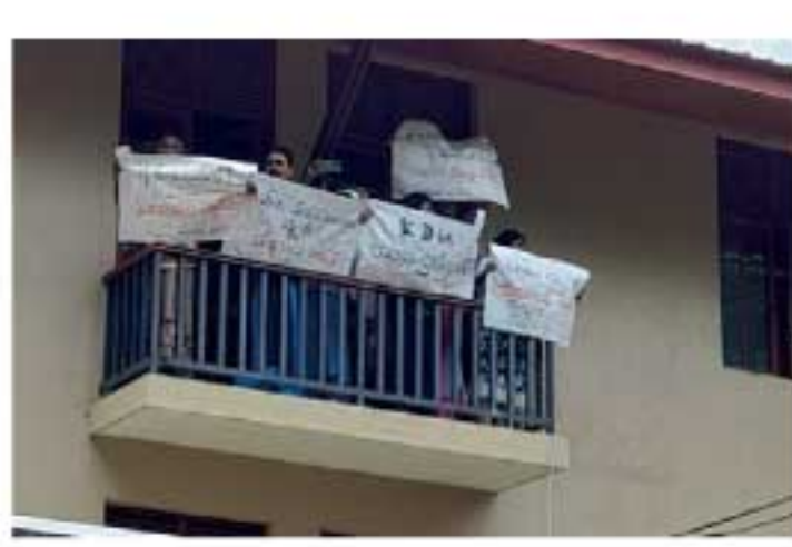
எதிர்ப்பு நடவடிக்கையில் நேற்று (14) ஈடுபட்டிருந்தார்.