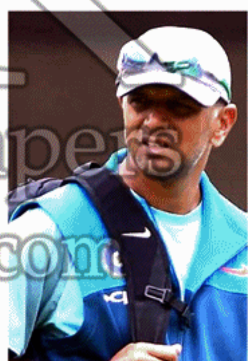
ளார் என்பது குறிப்பிடத்தக்கது. (4-6)

ராகுல் டிராவிட் இந்தியா 'ஏ' அணி, 19 வயதிற்குட்பட்டோருக்கான இளையோர் அணிகளுக்கு தலைமை பயிற்சியாளராக இருந்துள்ளார்.