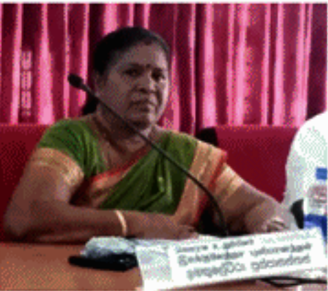
அவர் மேலும் தெரிவித்ததாவது. முல்லைத்தீவு மாவட்டத்