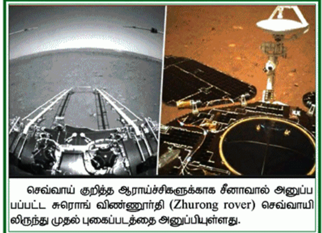
செவ்வாய் குறித்த ஆராய்ச்சிகளுக்காக சீனாவால் அனுப்பப்பட்ட சுரொங் விண்ணூர்தி (Zhurong rover) செவ்வாயிலிருந்து முதல் புகைப்படத்தை அனுப்பியுள்ளது.

ஒரு கால்டாக்ஸியை அம்புலன்ஸில் ஒட்சிசன், படுக்கை வசதிகளுடன், நோயாளிகளை சிகிச்சைக்காக அழைத்துச் செல்கிறோம். நோயாளிகளை அழைத்துச் செல்ல கட்டணம் ஏதும் வசூலிப்பதில்லை. அதேநேரம் எரிபொருள் செலவுக்காக அவர்கள் கொடுக்கும் தொகையையும் மறுப்பதில்லை என அவர் தெரிவித்தார். (3-4)