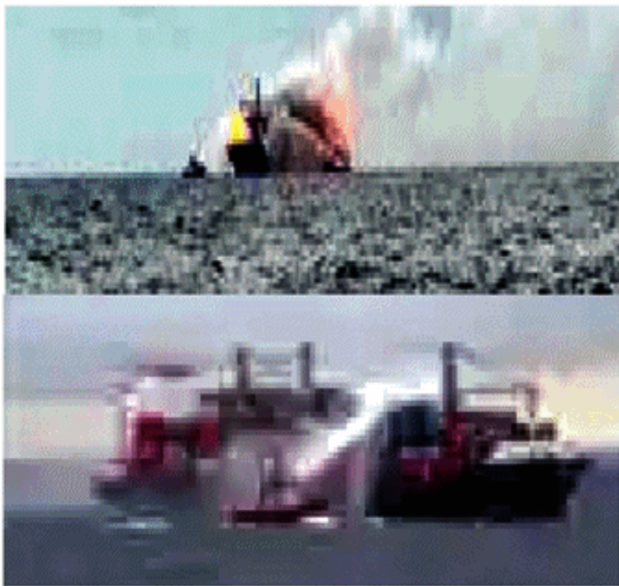
முயற்சியில் இலங்கை கடற்படையினர் ஈடுபட்டுள்ளதாகவும் தெரிவிக்கப்படுகின்றது. (நி-4)

கப்பலில் ஏற்பட்டுள்ள தீயினை கட்டுப்பாட்டிற்குள் கொண்டுவரும்