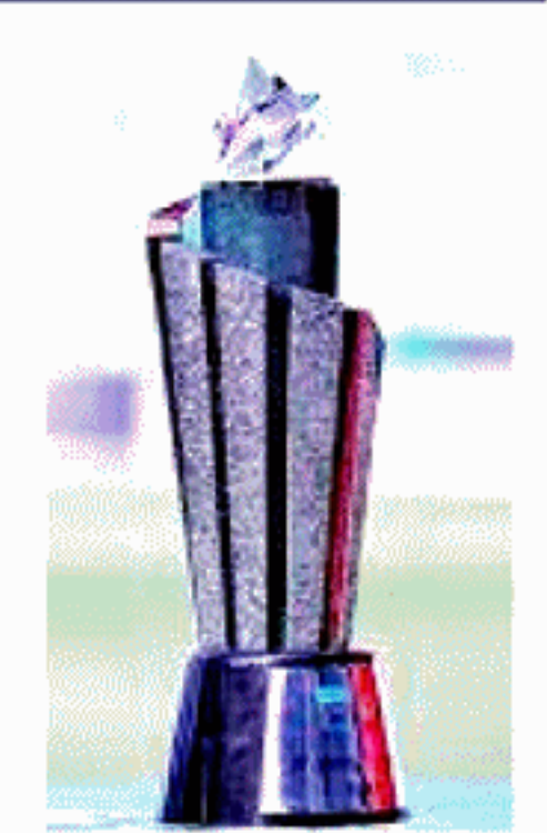
நிலையில், மீதமுள்ள 20 போட்டிகளும் எப்போது நடைபெறும் என்பதை விரைவில் அறிவிக்கவுள்ளது. (4-6)

தற்போது தொடரை நடத்துவதற்கான பணிகளை பாகிஸ்தான் கிரிக்கெட் சபை முன்னெடுத்து வருகின்ற