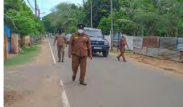
கையானது யாழ்ப்பாண நகரத்தின் முக்கியமான வீதிகளில் இடம்பெற்று வருகின்றமை குறிப்பிடத்தக்கது. (சூ-33)

திருப்பி அனுப்பப்படுகிறார்கள். அத்தோடு அத்தியாவசிய தேவையின் பொருட்டு வீதியில் பயணம் செய்வோரும் தமது பணி அடையாள அட்டை மற்றும் தமக்குரிய அனுமதிப்பத்திரங்களை காண்பித்த பின்னரே வீதியால் பயணிக்க அனுமதிக்கப்படுகிறார்கள். யாழ்ப்பாண பொலிஸ் நிலையத்தைச் சேர்ந்த விசேட பொலிஸ் அணியினரால் குறித்த நடவடிக்கை