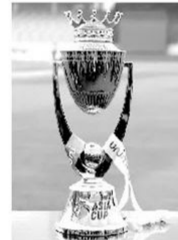
கிரிக்கெட் விளையாட முடியாத நிலை ஏற்பட்டது.

ஆசியக்கண்டத்தில் உள்ள அணிகளுக்கு இடையில் இரண்டு வருடத்திற்கு ஒருமுறை ஆசிய கிண்ண கிரிக்கெட் தொடர் நடத்தப்படும். உலகக் கோப்பையை கருத்தில் இருத்தி அதற்கு ஏற்றபடி இருபது-20 அல்லது ஒருநாள் கிரிக்கெட் தொடர் நடத்தப்படும். இந்த வருடம் இருபது-20 தொடர் நடத்தப்பட வேண்டும். கொரோனாத் தொற்று காரணமாக ஆசிய அணிகளான இந்தியா, பாகிஸ்தான், இலங்கை அணிகள் கடந்த ஆண்டு போதுமான அளவிற்கு