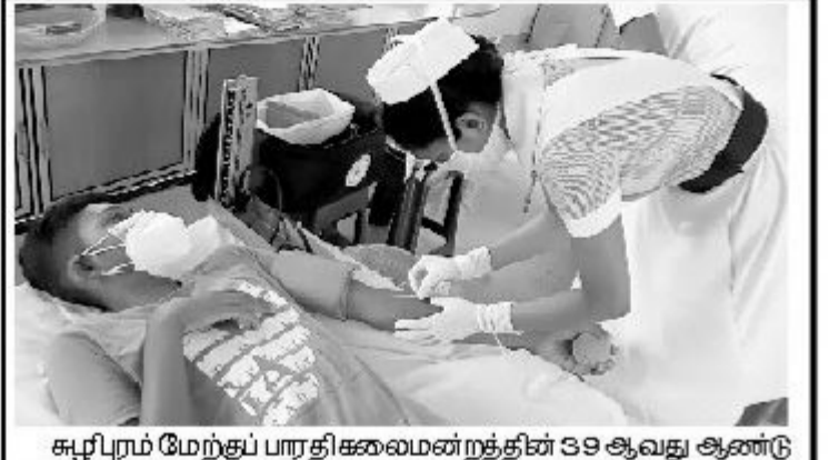
சுழிபுரம் மேற்குப் பாரதி கலைமன்றத்தின் 39 ஆவது ஆண்டு விழாவை முன்னிட்டுக் கலைமன்ற செயற்குழுவின் ஏற்பாட்டில் இரத்ததான முகாம் நேற்று முன்தினம் ஞாயிற்றுக்கிழமை சுழிபுரம் மேற்குப் பாரதி முன்பள்ளி மண்டபத்தில் நடைபெற்றது. பயணக்கட்டுப்பாட்டிற்கு மத்தியிலும் மேற்படி இரத்ததான முகாம் நிகழ்வு நடைபெற்றமை குறிப்பிடத்தக்கது. (படம்- ரவிசாந்த்)

பிரித்துப் போடும் கழிவுத் தொட்டிகளை வைக்கும் பணிகள் கடந்த சனிக்கிழமை இடம் பெற்றன. இதேவேளை, நேற்று முன்தினம் மக்கள் குப்பைகளைத் தரம் பிரித்துக் கொண்டு சென்று மேற்படி கழிவுத் தொட்டிகளில் இடுவதற்கான ஏற்பாடுகள் மேற்கொள்ளப்பட்டுள்ளன. (5-4-18)