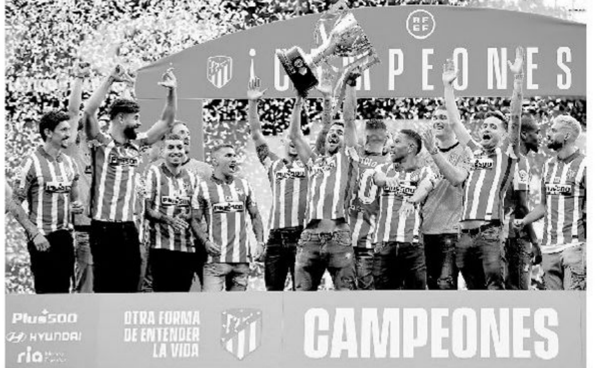
Plus500 HYUNDAI rido OTRA FORMA DE ENTENDER LA VIDA CAMPEONES

18 ஆவது நிமிடத்தில் பின்கள் வீரர்களை ஏமாற்றி வல்லாடோலிட் வீரர் ஆஸ்கர் பிளானோ முதலாவது கோல் அடித்தார். அதன் பிறகு அந்த அணிமேலும் சில ஷாட்டுகளை உதைத்த போதிலும் அத்லெடிக்கோ கோல் கீப்பர் ஜன் ஓபிளாக் அவர்களின் முயற்சிகளை முறியடித்தார். விறுவிறுப்பான ஆட்டத்தின் முடிவில் அத்லெடிக்கோ மாடரிட் அணி 2-1 என்ற கோல் கணக்கில் வல்லாடோலிடை தோற்கடித்தது. இதன்மூலம் அத்லெடிக்கோ மாடரிட் அணி 26 வெற்றி, 8 சமநிலை, 4 தோல்வி என்று 86 புள்ளிகளுடன் பட்டியலில் முதலிடத்தை பிடித்து கிண்ணத்தைத் தட்டிச் சென்றது. (3-4)