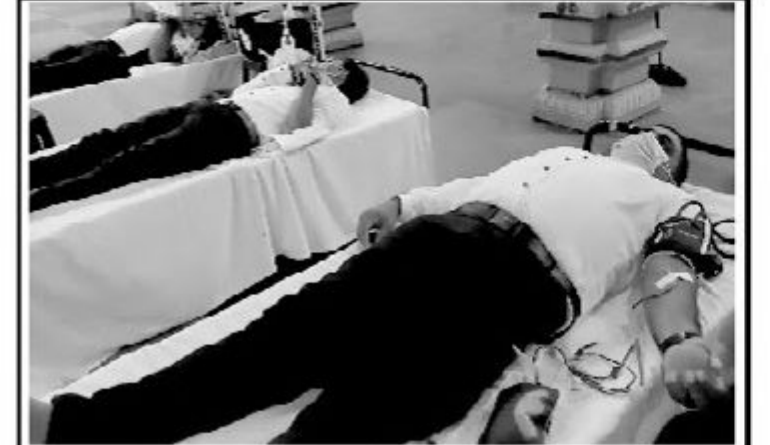
தன்னார் தொடர்பிக் கழகத்தின் ஏற்பாட்டில் யாழ்ப்பாணம் போதனா வைத்தியசாலை கிரத்த வளம்பி பிளீவின் அனுசரணையில் கிரத்ததான முகாம் நடந்த வெள்ளிக்கிழமை தன்னார் திண்பிள்ளை சங்க மண்டபத்தில் இடம்பெற்றது.