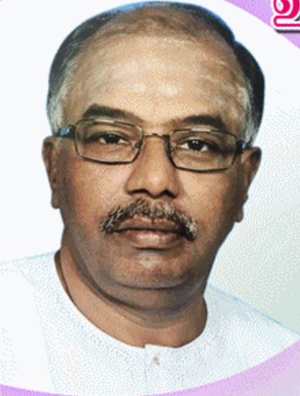
செஞ்சொற்செல்வர் கலாநிதி ஆறு திருமுருகன் பிவர்களுக்கு தீன்று மணிவிழா