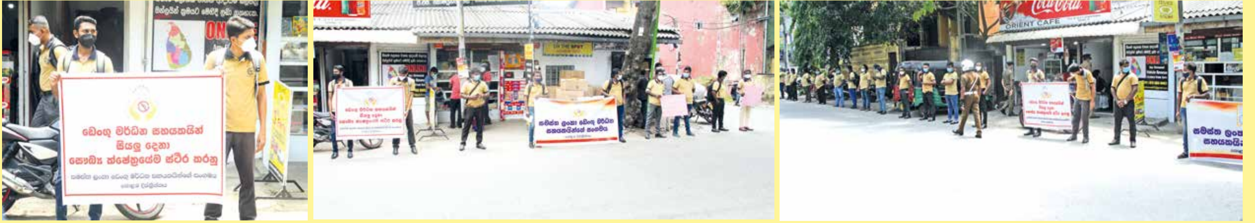
பெங்கு கட்டுப்பாட்டு உதவியாளர்கள் சகலரையும் நிரந்தரமாக்குமாறு கோரி, கொழும்பு பிரதேச சுகாதார சேவைகள் பணிப்பாளர் காரியாலயத்துக்கு முன்னால் நேற்று எதிர்ப்பு ஆர்ப்பாட்டமொன்று முன்னெடுக்கப்பட்டது.

நாட்டிலுள்ள பிரதான ஐந்து தேசிய விளையாட்டு சங்கங்கள்/சம்மேளனங்களின் பதிவுகளை தற்காலிகமாக இடைநிறுத்த இளைஞர் மற்றும் விளையாட்டுத்துறை அமைச்சர் நடவடிக்கை எடுத்துள்ளார். இந்த இடைநிறுத்தம் தொடர் பான வர்த்தமானி அறிவித்தல் நேற்று முன்தினம் வெளியிடப்பட்டுள்ளது. அதற்கமைய, இலங்கை வலைப்பந்தாட்ட சம்மேளனம், இலங்கை ஜூடோ சங்கம், இலங்கை ஸ்கிரிப்பல் சம்மேளனம், இலங்கை சர் பிங் சம்மேளனம் மற்றும் இலங்கை ஜூடோ சம்மேளனம் என்பனவே இவ்வாறு இடைநிறுத்தப்பட்டுள்ளன. தற்காலிக செயலொழுங்காக இந்த தேசிய விளையாட்டுச் சங்கங்களின் / சம்மேளனங்களின் நிர்வாகம் மற்றும் ஏனைய ஏதேனும் தொடர்புடைய நடவடிக்கைகள் மற்றும் பொறுப்பானவர் தேர்தல் ஆகியவற்றிற்கு அழைப்பு விடுப்பதற்கும் நடத்துவதற்கும் தீர்மானிக்கப்பட்டுள்ளது. அதுவரையில் உகந்தவிதமாக நிறைவேற்றுவதன் பொருட்டு கடந்த முதலாம் திகதியிலிருந்து அமுல்படுத்தும் வரையில் விளையாட்டு அபிவிருத்தி திணைக்களத்தின் பணிப்பாளர் நாயகம் அமல் எதிரிகுரிய பொறுப்பாக இருப்பார் என்றும் அந்த வர்த்தமானி அறிக்கையில் குறிப்பிடப்பட்டுள்ளது.