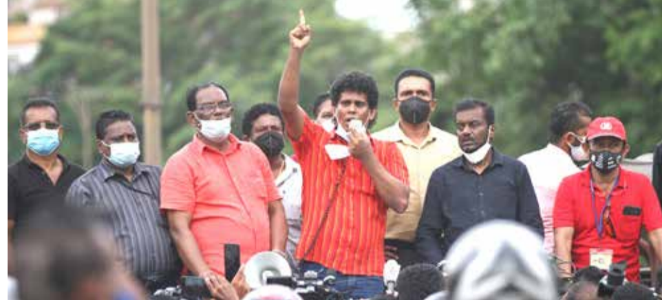
ஆசிரியர் தொழிற்சங்கத் தலைவர்களை தனிமைப்படுத்தியமை, மாணவர் ஒன்றியம் ஏற்பாடு செய்த எதிர்ப்பு போராட்டத்தின்போது தனிமைப்படுத்தல் சட்டத்தை மீறிய குற்றச்சாட்டில் கைதுசெய்யப்பட்டவர்கள் பிணையில் விடுவிக்கப்பட்டதன் பின்னர் அவர்களை தனிமைப்படுத்தியமை உள்ளிட்ட காரணங்களுக்காக ஏற்பாடுசெய்யப்பட்ட ஆசிரியர் தொழிற்சங்கங்கள் உள்ளிட்ட மேலும் சில தொழிற்சங்கங்களால் ஏற்பாடுசெய்யப்பட்ட எதிர்ப்பு ஆர்ப்பாட்டம் நேற்று கொழும்பில் இடம்பெற்ற போது..