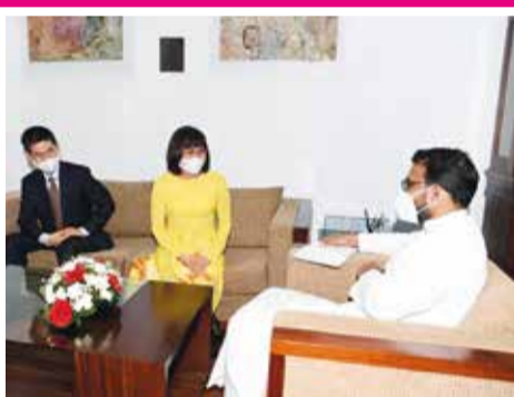
வழிவகுக்கும் வகையில், கொழும்புத் துறைமுக நகரத்தில் தொடர் கலந்துரையாடல்களுக்கான சந்தர்ப்பங்களை வழங்குவதற்கும் ஒப்புக் கொண்டார்.