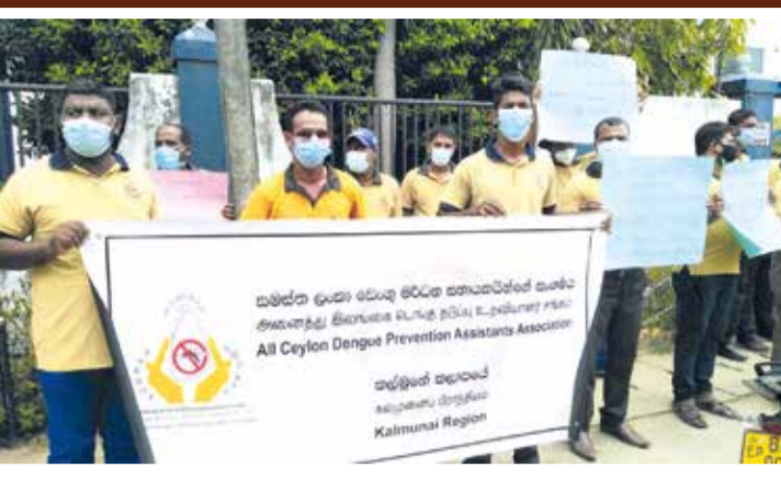
(ஏ.எம்.எம்.ஷிணான், பாறுக் ஷிணான்)

கல்முனை பிராந்திய சுகாதார சேவைகள் பணிப்பாளர் அலுவலகத்திற்குட்பட்ட பகுதிகளில் டெங்குத் தடுப்பு சுகாதாரப் பணியாளர்கள் தமக்கு நிரந்தர நியமனம் கோரி நேற்று (14) கல்முனை பிராந்திய சுகாதார சேவைகள் பணிமனைக்கு எதிரில் கவனயீர்ப்பு ஆர்ப்பாட்டத்தில் ஈடுபட்டனர். கடந்த நான்கு ஆண்டுகளாக பல்வேறு சிரமங்களுக்கு மத்தியில் சுகாதார அமைச்சின் கீழ் நாளாந்த கொடுப்பனவு அடிப்படையில் டெங்குத் தடுப்புப் பணியாளர்களாக நாம் கடமையாற்றி கொண்டிருக்கின்றோம். தற்போது அரசாங்கத்தின் ஒரு இலட்சம் தொழில் வாய்ப்புகளை வழங்கும் வேலைத்திட்டத்தின் கீழ் தம்மையும் இணைத்துக்கொள்ளவேண்டுக தகவல்கள் மூலம் அறியக் கிடைத்தது. இதனை நாம் வன்மையாக கண்டிக்கின்றோம். அவர்களுடைய சேவையோடு