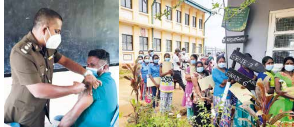
நுவரெலியா பொதுச் சுகாதார பிரிவுக்குட்பட்ட நானுலா நாவலர் கல்லூரியில் கொரோனா தடுப்பூசி வழங்கும் வேலைத்திட்டம் நேற்று இடம்பெற்றது. நானுலா பிரதேச பாடசாலைகளின் ஆசிரியர்கள், தோட்டப் பகுதிகளின் கள உத்தியோகத்தர்கள் மற்றும் 80 வயதுக்கு மேற்பட்டவர்களுக்கும் முதற்கட்ட ஊசிகள் வழங்கப்பட்டதுடன், இரண்டாம் கட்ட தடுப்பூசிகளை செலுத்திக்கொள்ள திகதி அறிவிக்கப்பட்டவர்களுக்கும் தடுப்பூசிகள் செலுத்தப்பட்டமை குறிப்பிடத்தக்கது. (நுவரெலியா)