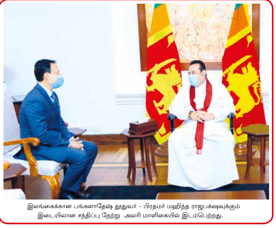
இலங்கைக்கான பங்களாதேஷ் தூதர் - பிரதமர் மஹிந்த ராஜபக்ஷவுக்கும் இடையிலான சந்திப்பு நேற்று அலரி மாளிகையில் இடம்பெற்றது.