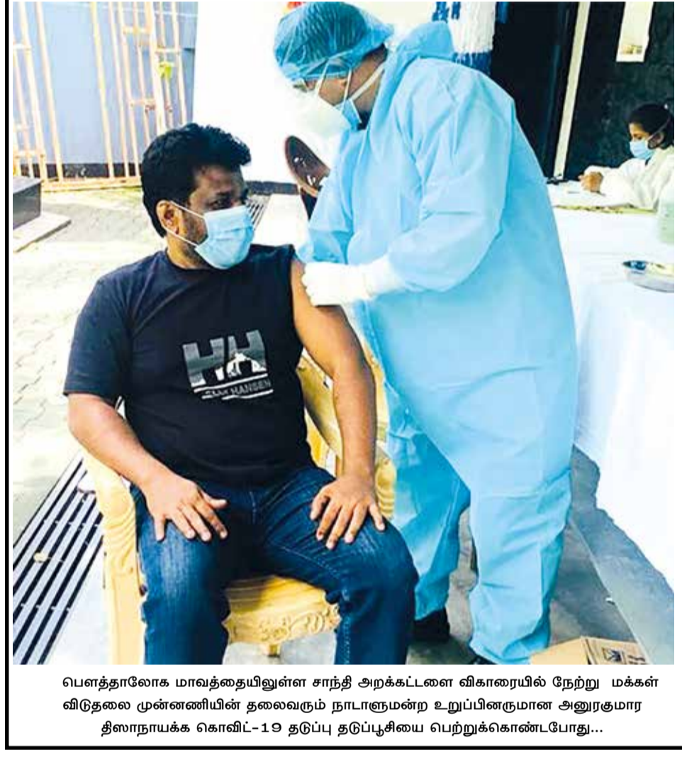
பெளத்தாலோக மாவத்தையிலுள்ள சாந்தி அறக்கட்டளை விகாரையில் நேற்று மக்கள் விடுதலை முன்னணியின் தலைவரும் நாடாளுமன்ற உறுப்பினருமான அனூருமார திஸாநாயக்க கொவிட்-19 தடுப்பு தடுப்பூசியை பெற்றுக்கொண்டபோது...