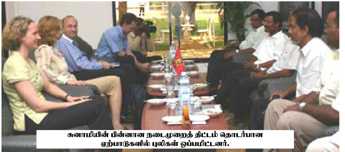
சுனாமியின் பின்னான நடைமுறைத் திட்டம் தொடர்பான ஏற்பாடுகளில் புலிகள் ஒப்பமிட்டனர்.

203.நீங்கள் பாலசிங்கத்தை அறிந்திருந்தீர்கள் தானே? அவரைப் பற்றிய உங்களது அனுமானம் என்ன?