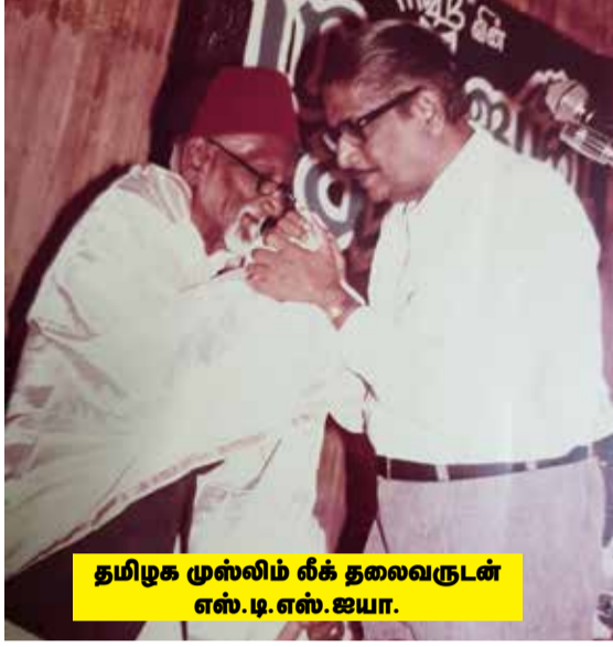
தமிழக முஸ்லிம் லீக் தலைவருடன் எஸ்.டி.எஸ். ஐயா.