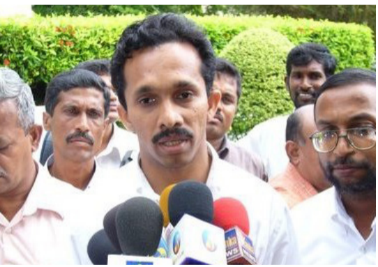
சுனாமியின் பின்னான நடைமுறைத் திட்டத்துக்கு எதிராக வழக்கு வைத்தது ஜே.வி.பி.

இருண்டவன் கண்களுக்கு மருண்டதெல்லாம் பேய். பார்ப்பவர்கள் கண்களைப் பொறுத்தது அது. அவர்களது மனோ பாவத்திலும் தங்கியுள்ளது என்பது போல. கூட்டாட்சியோ கூட்டமைப்பு ஆட்சியோ எல்லாமே பிரிவினைதான். ஆனால் இன்னுமொரு யதார்த்தத்தில் இரண்டுக்கும் இடையே பாரிய வித்தியாசங்கள் இல்லை. இரண்டுமே ஒரு நாட்டுக்குள் உட்பட்ட தீர்வு, தாயகக் கோட்பாட்டை அடிப்படையாக அமைந்தது. எவ்வளவு அதிகாரப் பரவல் நடக்கும், அதில் நடைமுறைப்படுத்தப்படும் அதிகாரங்கள் எவ்வளவு என்பதில்தான் வித்தியாசங்கள் இருந்தன. நல்லெண்ணங்கள் இருந்தால் அவை பேசித்தீர்க்கப்பட ஏதோ ஒன்றைப் பலப்படுத்தியோ அல்லது கலப்படமான அதிகாரங்களோடோ பயணித்திருக்கலாம். ஆனாலும் பாலசிங்கத்தின் சறுக்கல் நிவர்த்திக்கப்படவேண்டும் என்று குரல்கள் தொடர்ந்து இருந்ததால், பின்னர் நோர்வேயின் பேச்சுக்கள் குறித்த “போரும் சமாதானமும்” என்ற அவரின் 2004இல் புத்தகத்தில் ஒஸ்லோ தீர்மானத்தைக் கேள்விக்குறியாக்கி, அதனை அரசாங்கமும் நோர்வேயும் மிகைப்படுத்தின எனவும் அது விடுதலைப் புலிகளின் அரசியல் கோட்பாடுகளிலிருந்து மாறுபடவில்லை எனவும் விளக்கப்படுத்தி எழுதினார். உள்ளக சுயநிர்ணய உரிமையில் (Internal Self Determination) ஒரு தீர்வைப்பார்ப்போம் என இணங்