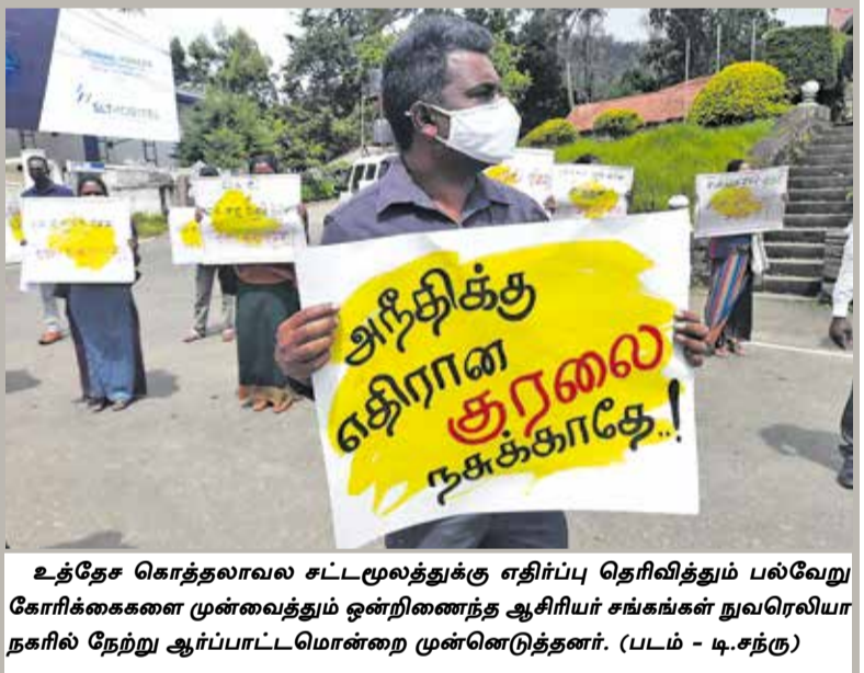
உத்தேச கொத்தலாவல சட்டமூலத்துக்கு எதிர்ப்பு தெரிவித்தும் பல்வேறு கோரிக்கைகளை முன்வைத்தும் ஒன்றிணைந்த ஆசிரியர் சங்கங்கள் நுவரெலியா நகரில் நேற்று ஆர்ப்பாட்டமொன்றை முன்னெடுத்தனர்.