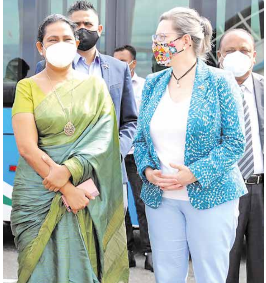
கட்டார் விமான சேவைக்குச் சொந்தமான விமானத்தினூடாக அமெரிக்காவின் 1.5 மில்லியன் மொடர்னா தடுப்பூசிகள் கட்ருநாயக்க சர்வதேச விமான நிலையத்துக்கு நேற்று வந்தடைந்தன. இந்தத் தடுப்பூசிகளை பெற்றுக்கொள்வதற்காக சுகாதார அமைச்சர் பவித்ரா தேவி வன்னியாராச்சி மற்றும் அமெரிக்கத் தூதுவர் அலைனா பி.டெல்லிட்ஸ் ஆகியோர் விமான நிலையத்துக்கு சென்றிருந்தபோது எடுக்கப்பட்ட படம்.