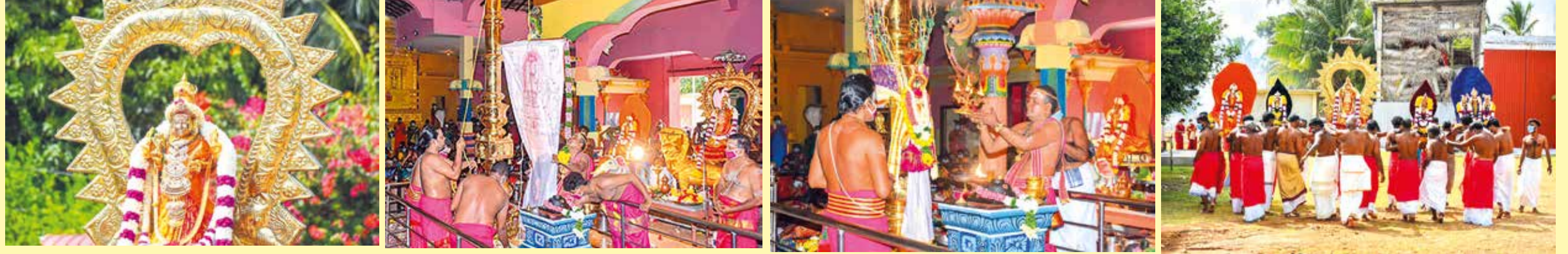
யாழ்ப்பாணம், வண்ணை ஸ்ரீ வீரமாகாளி அம்மன் கோவில் வருடாந்தத் திருவிழா நேற்றுக் காலை 8 மணிக்கு கொடியேற்றத்துடன் ஆரம்பமாகியது.

இளைஞர் விவகார மற்றும் விளையாட்டுத்துறை அமைச்சர் நாமல் ராஜபக்ஷ தெரிவித்தார். வடக்கு - கிழக்கு மாகாண மக்களுக்கான தடுப்பூசி ஏற்றும் செயற்பாட்டை விரைவுபடுத்துவது தொடர்பில் அமைச்சர் நாமல் ராஜபக்ஷ, ஜனாதிபதி கோட்டாபய ராஜபக்ஷவுடன் கலந்துரையாடி இவ்விசேட திட்டத்தை ஏற்பாடு செய்துள்ளார். அதற்கமைய வடக்கு, கிழக்கு மாகாணங்களை சேர்ந்த 30 வயதிற்கு மேற்பட்ட அனைவருக்கும் எதிர்வரும் இரண்டு மாதங்களுக்குள் கொவிட் தடுப்பூசிகளை பெற்றுக்கொடுப்பதற்கு நடவடிக்கை மேற்கொள்ளப்படும்.