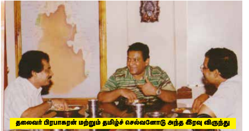
தலைவர் பிரபாகரன் மற்றும் தமிழ்ச் செல்வனோடு அந்த இரவு விருந்து

1996 இல் யாழ்ப்பாணக் குடாநாட்டைப் புலிகள்