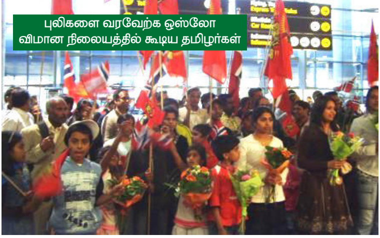
புலிகளை வரவேற்க ஒஸ்லோ விமான நிலையத்தில் கூடிய தமிழர்கள்

இவை பற்றி இருதரப்பினரோடும் தனித்தனியாக நோர்வே பேசிய பின் விடுதலைப் புலிகள் நாடு திரும்புமுன் தமிழ்ச்செல்வன் 9 ஜூன் 2006 நோர்வேயில் அவர்களது புத்திஜீவிகள் தயாரித்த அதிருப்தி செய்தி அறிக்கையை வெளியிட்டு வைத்தார். அதில் 63 காரணங்களையும் சர்வதேசத்தின் போக்கையும் இலங்கை அரசின் போக்குகளை கணக்கெடுத்தும் விடுதலைப் புலிகளின் தமிழர் தேசியத்துக்கான ஒரு