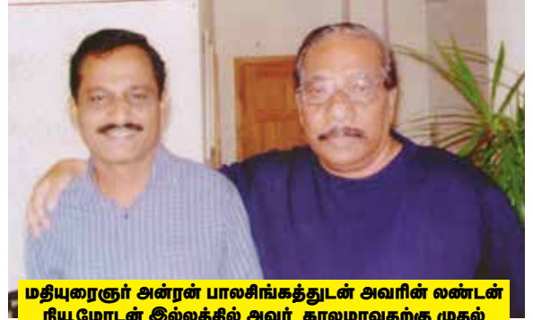
மதியுரைஞர் அன்ரன் பாலசிங்கத்துடன் அவரின் லண்டன் நியுமோடன் கில்லத்தில் அவர் காலமாவதற்கு முதல் வாரம் எடுத்த படம். இதுவே பாலா அண்ணன் உயிருடன் இருந்த போது எடுத்த கடைசி படமும் கூட.

களை, கட்டுரைகளை, ஆசிரிய தலையாங்கங்களை எழுது. அப்போதுதான் நீயும் உன் புத்திரிகையும் மக்கள் மனதில் - தமிழ் மக்கள் மனதில் - உலகின் கணக்கில் - வெல்ல முடியும்” என்று திரும்பத் திரும்பச் சொல்வார். அவை மீறப்பட்டன எனக் கருதப்படும் இடங்களைக் குறித்து வைத்து அடுத்த நாள் நேரில் கூட்டிக்காட்டுவார்.