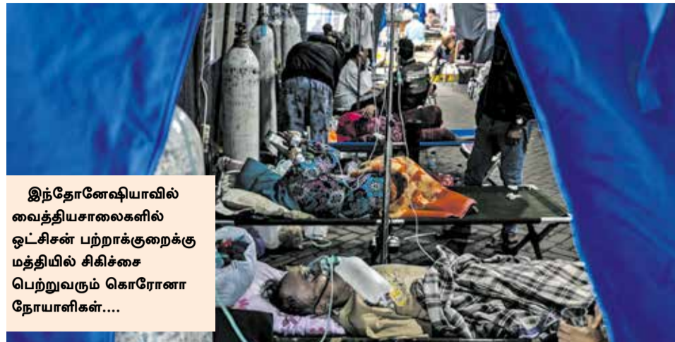
இந்தோனேஷியாவில் வைத்தியசாலைகளில் ஓட்சிசன் பற்றாக்குறைக்கு மத்தியில் சிகிச்சை பெற்றுவரும் கொரோனா நோயாளிகள்....

இந்நிலையில், உலகம் முழுவதும் இதுவரை (பத்திரிகை அச்சுக்குச் செல்லும் வரை) கொரோனாவால் 19,09,14,324 பேர் பாதிக்கப்பட்டுள்ளதுடன், 41,01,542 பேர்