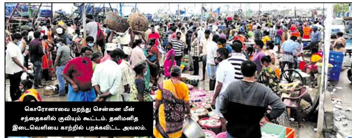
கொரோனாவை மறந்து சென்னை மீன் சந்தைகளில் குவியும் கூட்டம். தனிமனித இடைவெளியை காற்றில் பறக்கவிட்ட அவலம்.

கடும் மழையால் மும்பையை பெரும் வெள்ளம் சூழ்ந்துள்ளது. மும்பையின் பல்வேறு பகுதிகளில் நேற்றுமுன்தினம் இரவுமுதல் தொடர் மழை பெய்து இதனால் போக்குவரத்து பாதிக்கப்பட்டு, மக்களின் இயல்பு வாழ்க்கையும் முடங்கியது. தாழ்வான பகுதிகளில் வீடுகளுக்குள்ளேயும் மழைநீர் புகுந்ததால் மக்கள் அவதிக்குள்ளாகியுள்ளனர்.