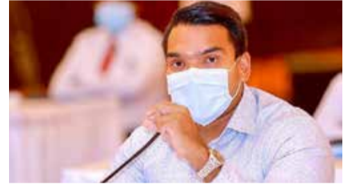
மையங்களைப் பிரதிநிதித்துவப்படுத்தும் 18 வயதுக்கு மேற்பட்டவர்களுக்குத் தடுப்பூசி வழங்க நடவடிக்கை எடுக்கப்படும் என்றும் அவர் தெரிவித்துள்ளார்.