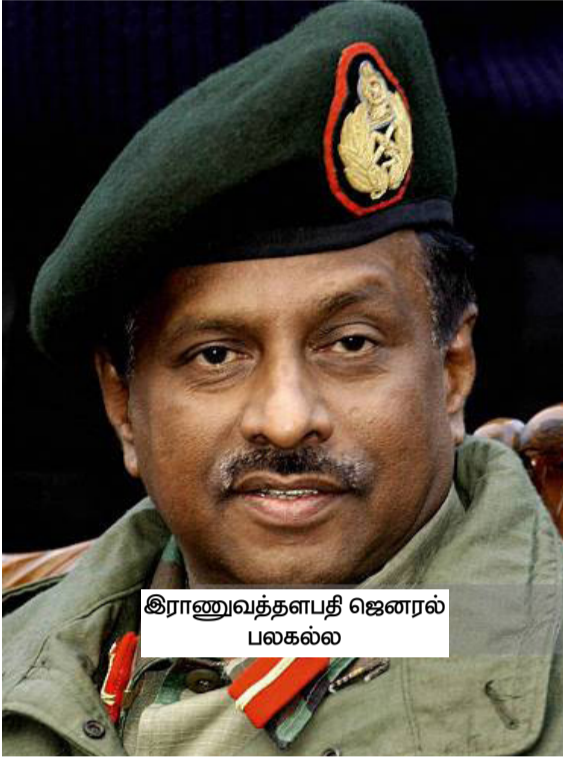
இராணுவத்தளபதி ஜெனரல் பலகல்ல