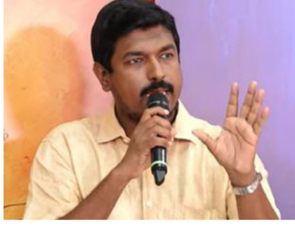
பயங்கரவாத தடைச் சட்டத்தை முற்றாக நீக்குவதற்கு சர்வதேசத்தினுடைய அழுத்தம் மிக முக்கியமானது என தமிழ்த்