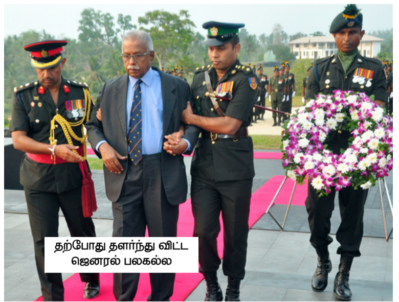
தற்போது தளர்ந்து விட்ட ஜெனரல் பலகல்ல

அந்தச் சம்பவத்துக்கு சுமார் 45 நிமிடங்களுக்கு முன்னர் சிவப்பு நிற மோட்டார் சைக்கிள் ஒன்றில் 'உதயன்' பிரதிநிதி ஒருவர் வந்து சுமார் 25 நிமிட நேரம் குல