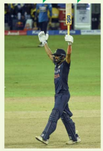
டி சிவ்வாவுமீள் குறிப்பிட்ட இடைவெளிகளில் பன்னேவ் குமாரி, தீக்க சூலரிடம் வீழ்த்தார்.

ஒவர்களில் 9 வீக்கெட்டுகளை இழந்து 275 ஓட்டங்களை இலங்கை பெற்றது. பதினாறு, 276 ஓட்டங்களை துடுப்பெடுத்தாடிய இந்தியா, ஆரம்பத்திலேயே பிறித்திவி வார, இலங்கை கிஷண ஹலரங்க, ராஜிதவிடம் இழந்தது. பின்னர் அணித்தலைவர் ஷீக் தவானை 29 (38) ஓட்டங்களுடன் ஹலரங்கவிடம் இழந்த இந்தியா, மனிஷ் பன்னடியாவை 37 (31) ஓட்டங்களுடன் ரன் அடிப்படையில் குறிப்பிட்ட நேரத்தில் பின்னர் இழந்ததுடன், அடுத்து வந்த ஹரிஷ்க் பன்னடியாவையும் தகன் ஞானகவிடம் உடனே பறிக்கொடுத்தது. இதையடுத்து குரியகுமார் யாதவ்யும், குரானா பன்னடியாவும் இந்தியாவின் இனிவையக் கட்டியெழுப்பிய நிலையில், 53 (54) இலங்கைக்குள் குரியகுமார் யாதவ்யையும், 35 (54) இலங்கைக்குள் குரானா பன்னடியாவையும் குறிப்பிட்ட இடைவெளிகளில் வலங்கை சக்தகான், ஹலரங்கும் குறிப்பிட்ட இந்தியா இழந்திருந்தது. எவ்வாறாயினும், பன்னேவ் குமாரின் இணைப்பில், தீக்க சூலர் பெற்ற ஆட்டமிடக்காத 69 (68) இலங்கைக்குள் அவரை பன்னேவ் குமாரிடம் வீழ்த்தார். தொடர்ந்து வந்த குடிமீட்ட சமீரவும் பன்னேவ் குமாரின் வீழ்த்தப்போதும், சாமிக் குரானாநிவின் ஆட்டமிடக்காத 44 (33) இலங்கைக்குள் 50