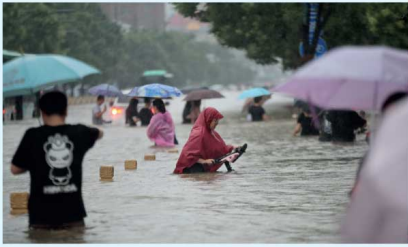
தெரிவித்துள்ளன. சனிக்கிழமை (21) மாணவரின் ஒரு நேற்று முன்தினமியர் வரவு லெங்ஸாங் 617.1 மில்லிமீற்றர் மழை வீழ்ச்சி பதிவாகியுள்ளது.

சீனாவின் மத்திய ஹெனான் மாகாணத்தின் பெருமளவான பகுதிகள் நேற்று (21) மூழ்கியுள்ளன. ஹெனான் மாகாணத்தின் தலைநகரான லெங்ஸாங் மோசாமாகப் பாதிக்கப்பட்டுள்ளது. 1,000 ஆண்டுகளில் இல்லாத கடும் மழையாலேயே இப்பாதிப்புகள் ஏற்பட்டன. மஞ்சள் ஆற்றின் கரையிலுள்ள லெங்ஸாங் நகரத்தில் சுரம்பயாழை ஒன்றி ஏற்பட்ட வெள்ளத்தால் 12 பேர் இறந்ததோடு, 500க்கும் மேற்பட்டோர் பாதுகாப்பாக வெளியேற்றப்பட்டதாக உள்விவரம் அடையாளப்பட்டுள்ளது.