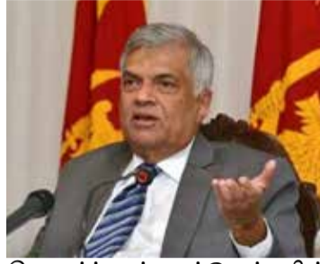
தொடர்ந்தால் நாட்டு மக்களின் எதிர்காலம் கேள்விக்குள்ளாக் கப்படும் என்றும் ரணில் விக்கிர மசிங்க தெரிவித்தார்.

நாட்டில் தேசிய பொருளா தாரம், ஜனநாயகக் கொள்கை ஆகியவை பாதிப்புக்குள்ளாக்கி யுள்ள நிலையில் நாட்டின் எதிர்காலம் அச்சுறுத்தலுக்குள் ளாகியுள்ளது என்றும் அவர் குறிப்பிட்டார். இவ்வாறு குடும்ப ஆட்சி