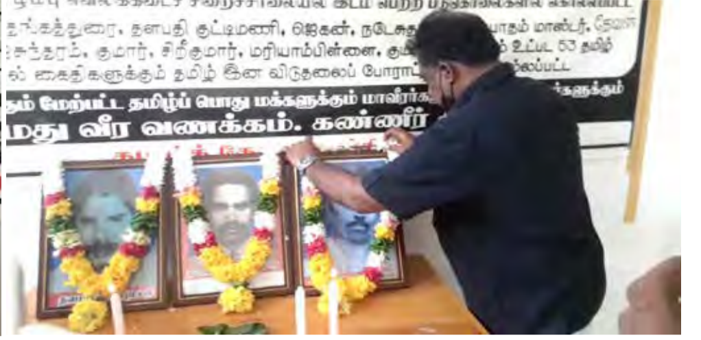
யாழ்ப்பாணம், ஜூலை 26 வெலிக்கடை சிறைச்சாலையில் படுகொலை செய்யப்பட்ட குட்டிமணி மற்றும் தலைவர் தங்கத்துரை ஆகியோரின் 38ஆவது நினைவேந்தல் நிகழ்வு, யாழ்ப்பாணத்தில் நேற்று நடைபெற்றது.