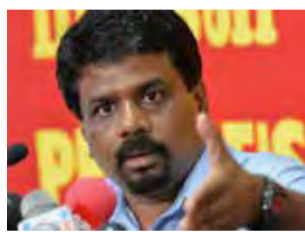
இலங்கையில் மீண்டும் இனவாத அரசியலை அரசு கையில் எடுத்துச் செயல்பட ஆரம்பித்துள்ளது. எனவே, நாட்டில் மாற்றம் ஒன்று கட்டடாயம் தேவை. புதிய மாற்றத்துக்கான அணியொன்றை உருவாக்கும் ஆக்கபூர்வமான செயல்பாடுகளை நாம் முன்னெடுத்து வருகின்றோம். அதற்கு மக்கள் ஒத்த துழைக்க வேண்டும்” - என்றார். (இ)

ததாவது: - “பொதுமக்கள் உரிமைகளைக் கட்டுப்படுத்தும் சட்டங்களை அரசு உருவாக்கி வருகின்றது. இலங்கையில் முன்னரை விட மிக மோசமான முறையில் குடும்ப ஆட்சி இப்போது வலுப்பெற்றுள்ளது. ஒரே நாடு - ஒரே சட்டம் என்ற வாக்குறுதிகளை வழங்கிய ராஜபக்சவினர் இன்று அதனைத் தவிர்ப்பொடியாக்கி விட்டனர். நாட்டின் பொருளாதார வீழ்ச்சி மக்களிடையே மிகப் பெரிய அதிருப்தியை ஏற்படுத்தியுள்ளது. மக்களின் வாழ்வாதாரம் பாதிக்கப்பட்டுள்ளது.