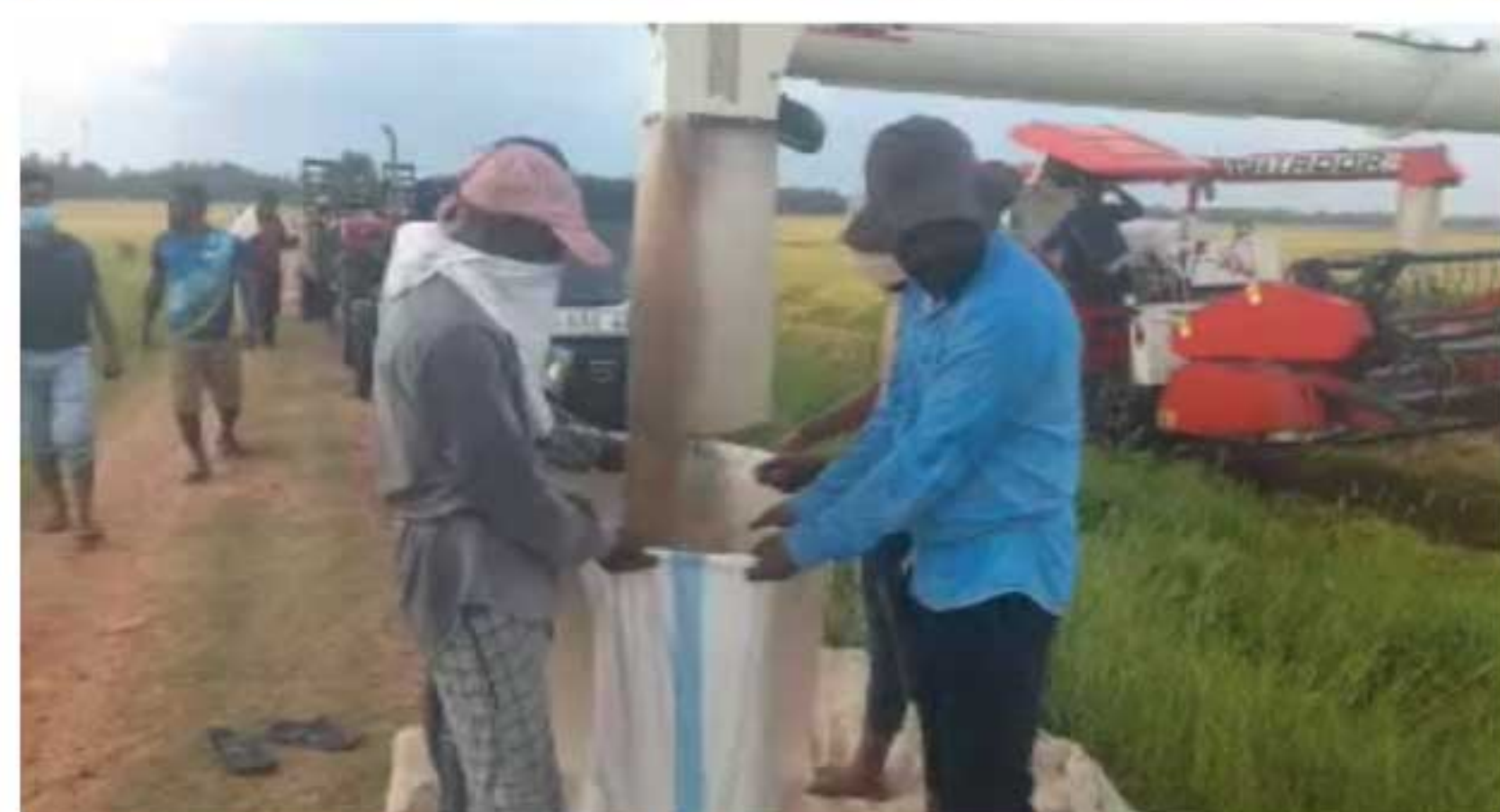
நடவடிக்கைகளை மேற்கொள்ள வேண்டும்.