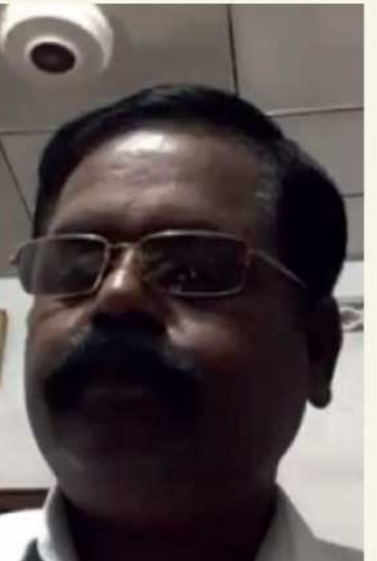
இதில் வடக்கின் ஊடகவியலாளர்களுக்கு, தெற்கின் அரசியல்வாதிகள், சிவில் சமூக செயற்பாட்டாளர்கள், மதத் தலைவர்களுடன் தொடர்புபடுவதற்கான சந்தர்ப்பத்தை அளிக்கும் செயற்றிட்டம், கடந்த 21ஆம் மற்றும் 22ஆம் திகதிகளிலும் நேற்று (23) கும் தொழில்நுட்பம் ஊடக முன்னெடுக்கப்பட்டது.

இதன்போது, முதலில் குறித்த இரகசியப் பிரமுகருக்கோ, சிவில் சமூக செயற்பாட்டாளருக்கோ தற்போதைய அரசியல் சூழ்நிலை தொடர்பில் கருத்துகளை முன்வைக்க 20 நிமிடங்கள் வழங்கப்பட்டன. அதன் பின்னர் குறித்த அரசியல் பிரமுகர்களிடமும், சமூக செயற்பாட்டாளர்களிடமும் வடக்கின் ஊடகவியலாளர்கள் கேள்விகளைத் தொடுத்து, பதில்களைப் பெற்றுக்கொண்டனர். இச்செயற்றிட்டத்தில், தேர்தல்கள் ஆணைக் குழுவின் முன்னாள் தலைவர் மற்றும் எல்லை நிர்ணய ஆணைக் குழுவின் தலைவர் மூவ்ந்த தேசப்பிரியவின் கருத்துகளும் கூட்டிக்காட்டத்தக்கன. அதாவது, ஊடகவியலாளர்கள் மிகவும் காத்தரமான பங்களிப்புகளை அரசியல் பிரமுகருக்கோ, சிவில் சமூக செயற்பாட்டாளருக்கோ தற்போதைய அரசியல் சூழ்நிலை தொடர்பில் கருத்துகளை முன்வைக்க 20 நிமிடங்கள் வழங்கப்பட்டன. அதன் பின்னர் குறித்த அரசியல் பிரமுகர்களிடமும், சமூக செயற்பாட்டாளர்களிடமும் வடக்கின் ஊடகவியலாளர்கள் கேள்விகளைத் தொடுத்து, பதில்களைப் பெற்றுக்கொண்டனர்.