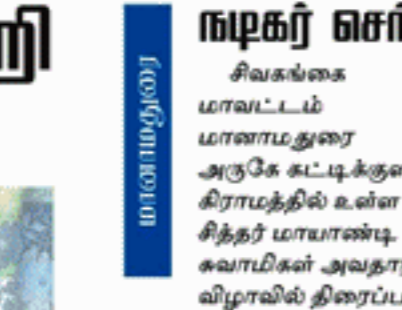
கருப்பனேந்தல் மடத்துக்கு வந்தார். மடத்தின் நிர்வாகிகள் அவரை வரவேற்றனர். அதைத்தொடர்ந்து நடிகர் செந்தில் சுவாமி தரிசனம் செய்தார். அவருக்கு மாயாண்டி சுவாமிகளின் வாழ்க்கை வரலாறு குறித்து கருப்பனேந்தல் மடத்தின் நிர்வாகிகள் விளக்கிக் கூறினர்.

சிவகங்கை மாவட்டம் மானாமதுரை அருகே கட்டிக்கூடம் கிராமத்தில் உள்ள சித்தர் மாயாண்டி சுவாமிகள் அவதார விழாவில் திரைப்பட நடிகை நடிப்பு செந்தில் பங்கேற்று சுவாமி தரிசனம் செய்தார். கட்டிக்கூடம் கருப்பனேந்தல் மடத்தில் சித்தர் மாயாண்டி சுவாமிகளின் 164 வது அவதார விழா நடைபெற்று வருகிறது. இந்நிலையில் திரைப்பட நடிகர் செந்தில்