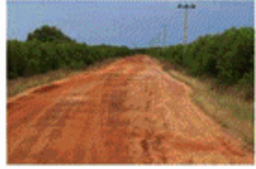
மேற்படி நினைக்கலம் தெரிவித்துள்ளது ஆகவே, குறித்த கௌதாரிமுனை - பூநகரி வீதியைப் புனரமைப்பதற்கு 1,300 மில்லியன் ரூபாய்க்கு மேற்பட்ட நிதி ஒதுவதென நினைக்கலத்தால் தெரிவிக்கப்பட்டுள்ளது.

■ கபீர்மீன் பண்டார பூநகரி - கௌதாரிமுனை வீதியைப் புனரமைப்பதற்கு சுமார் 1,300 மில்லியன் ரூபாய் நிதி ஒதுவை என, வீதி அபிவிருத்தி நினைக்கலம் தெரிவித்துள்ளது. இதேவேளை, நினைக்கலத்துக்குச் சொந்தமான மிக நீண்ட வீதிகளாகக் காணப்படுகின்ற 16 கிலோ மீற்றர் நீளமான பேய்ப்பாறைப்பிட்டி - கல்வாறு வீதி, 13 கிலோ மீற்றர் நீளமான கௌதாரிமுனை - பூநகரி என்பன புனரமைக்கப்பட்டு நிலையில் காணப்படுவதாகவும்,