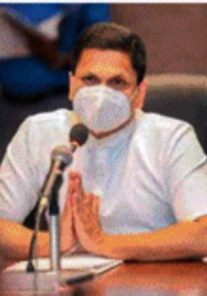
பூராகவும் கொடூரான கொக்குணிகளை உருவாக்கி வருவதுடன், குறைந்தது அவர்களுக்கு உள்ள பொறுப்பைக் கூட அவர்கள் நிறைவேற்றவில்லை. இது தேர்தலுக்கான தேரமோ அரசியல் ஒழுங்குப் பத்திரத்துக்கு அமைய செயற்படும் தேரமோ

எதிர்க்கட்சியினர் நாடு முழுவதும் கொடூரான கொக்குணிகளை உருவாக்குவதாகத் தெரிவித்த கிராமிய வீதி உட்கட்டமைப்பு இராஜாங்க அமைச்சர் நிமல் வன்சா, இலங்கை மட்டுமல்ல, முழுமலகும் கொடூரான கொக்குணிகளை முகம் கொடுத்துள்ள நிலையில், நாட்டு மக்களைப் பாதுகாக்கும் பொறுப்புக்கு பங்களிப்போ, அதற்கான முன்னுதரணமாகவோ எதிர்க்கட்சியிடம் காணப்படவில்லை என்றார். எதிர்க்கட்சியினர் க்காதார ஆலோசனைகளைப் பின்பற்றாமல் எதிர்ப்பு நடவடிக்கைகளை முன்வைத்து, நாடு