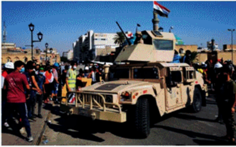
கருத்தை பிரதமர் அல்-காடூஹி வெளிப்படுத்தியுள்ளார். இதேவேளை, இனியும் ஐ.அமெரிக்க பயிற்சியை மற்றும் இராணுவப் புலனாய்வுச் சேகரிப்பை ஈராக்க கோரும் என பிரதமர் அல்-காடூஹி தெரிவித்துள்ளார்.

ஈ.எல்.ஐ.எல் ஆயுதக் குழுவுடன் சண்டையிடுவதற்கு ஐக்கிய அமெரிக்க சண்டைப் படைகள் இனி ஈராக்குக்கு தேவையில்லை என ஈராக்கின் பிரதமர் முஸ்தபா அல்-காடூஹி தெரிவித்துள்ளார். எவ்வாறாயினும், உத்தியோகபூர்வமாக ஐ.அமெரிக்கப் படைகள் வரப்பெறும் உத்தியோகபூர்வ காலப் பகுதியானது இவ்வாறு ஐ.அமெரிக்க அதிகாரிகளுடனான பிரதமர் அல்-காடூஹியின் பேச்சுக்களிலேயே தீர்மானிக்கப்படும் எனத் தெரிகிறது. த அஷோஷியேட் பிரஸ் செய்தி முகவரகத்துடனான நேர்காணல் ஒன்றிலேயே குறித்த