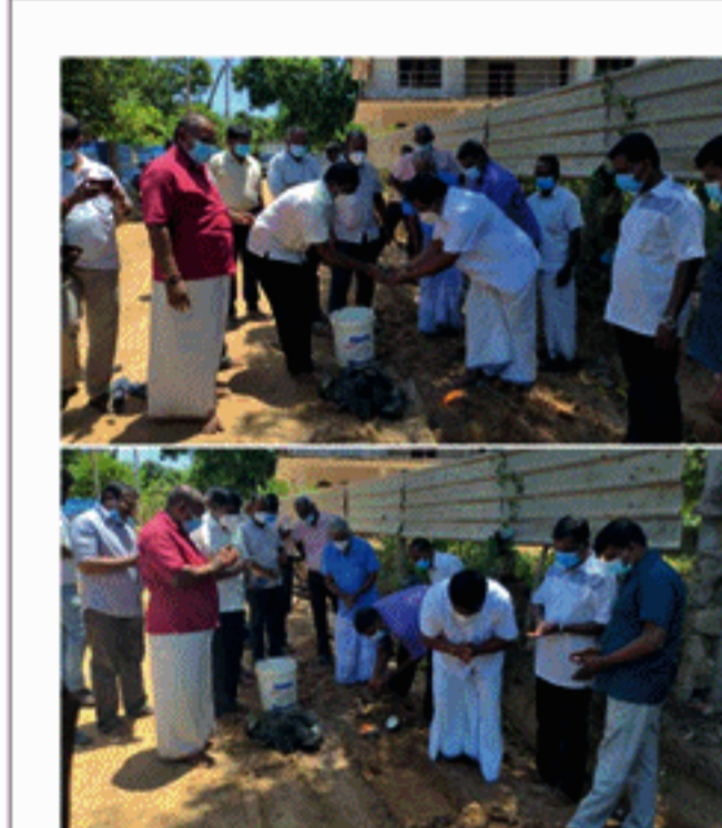
இருந்தும், இரண்டு மீட்டர், நானூறு மீட்டர்கள் செலவிட்டு பணிகள், ஒரே முனிசிம் (24) இரண்டு மீட்டர்கள், டப்டிபிடி ஸ்பிரிங்கிள் மானிட்டர்

வயது வரை நோய்களின்றி நுகரக்கூடிய வாழ்ந்தார்கள். ஆனால், பசுணைப் புரட்சி என்ற போர்வையில் விவசாயிகள் இராசாயனப் பசுணைகளைப் பாவிக்க ஊக்குவிக்கப்பட்டார்கள். அதனால் இன்று உணவுப் பாதுகாப்பு என்பது அச்சுறுத்தலாக மாறியுள்ளது. இராசாயனமின்றி விவசாயம் செய்யமுடியாதென்ற நிலைக்கு இட்டுச் சென்றது. விவசாயிகளை மக்கள் புற்றுநோய், சிறுநீரக நோய் எனப் பல நோய்களால் பீடிக்கப்பட்டனர். மக்களின் வாழ்க்கைக் காலமும் சுருங்கியுள்ளது. எனவே, நாம் மீண்டும் பண்டைய யுகத்துக்குச் செல்ல வேண்டும். சேனப் பணைகளை உற்பத்தி செய்து, எமது விவசாயத்தை வளம்படுத்த வேண்டும். அதனுடான நோய்களற்ற நுகரக்கூடியமான சமுதாயமொன்றை உருவாக்கவேண்டும் என்றார்.