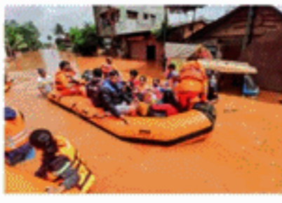
136 பேர் உயிரிழந்ததாக மாநில பேரிடர் மேலாண்மைத் துறை தெரிவித்துள்ளது. முன்னதாக, மாநில முதலமைச்சர் அலுவலகம்

மகாராஷ்டிரத்தில் கனமழை பெய்து வருவதைத் தொடர்ந்து ஏற்பட்ட வெள்ளம் மற்றும் நிலச்சரிவில் சிக்கி 136க்கும் அதிகமானோர் பணியாகியுள்ளதாக தெரிவிக்கப்பட்டுள்ளது. வெள்ளம், நிலச்சரிவால் பாதிக்கப்பட்ட பகுதிகளில் மீட்புப் பணிகள் தீவிரமடைந்துள்ளன. வெள்ளம், மழை தொடர்பான விபத்துகள், நிலச்சரிவு ஆகியவற்றால் கடந்த 3 நாட்களில்