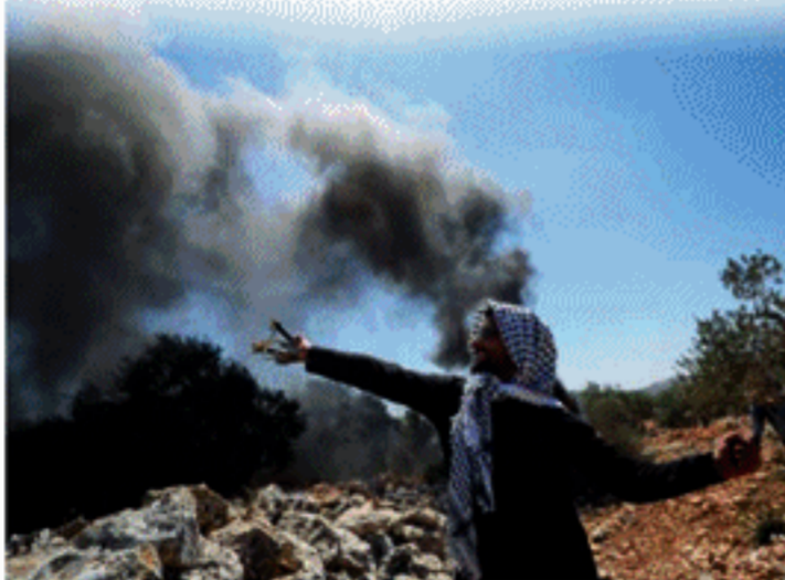
ஒருவர் உயிரிழந்ததாக பலஸ்தீன அதிகாரிகள் தெற்று முன்நினை தெரிவித்துள்ளனர். இந்நிலையில், குறித்த மோதல்களில் 320 பலஸ்தீனர்கள் காயமடைந்ததாக செம்பிறைச் சங்கம் தெரிவித்துள்ளது.

ஆக்கிரமிக்கப்பட்ட மேற்குக் கரையில் சுடல் ரீதியற்ற இஸ்ரேலியக் குடியிருப்புகள் தொடர்பான ஆர்ப்பாட்டம் ஒன்றில் இஸ்ரேலியப் படைவீரர்களால் சுடப்பட்டதைப்படுத்து பலஸ்தீன பதினம் வயதுக்காரர் ஒருவர் உயிரிழந்ததாக பலஸ்தீன அதிகாரிகள் தெற்று முன்நினை தெரிவித்துள்ளனர். இந்நிலையில், குறித்த மோதல்களில் 320 பலஸ்தீனர்கள் காயமடைந்ததாக செம்பிறைச் சங்கம் தெரிவித்துள்ளது.