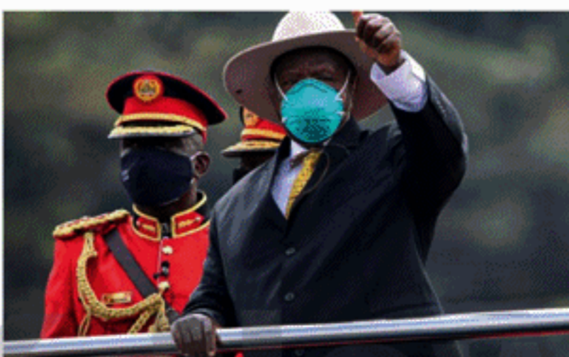
மாத வருமானம் 28 ஐக்கிய அமெரிக்க டொலர் என்பதுடன், ஆசிரியர் ஒருவரின் ஊதியமானது 75 ஐக்கிய அமெரிக்க டொலர் என்பது குறிப்பிடத்தக்கது. கடந்த 2018ஆம் ஆண்டு இதே போன்ற நகர்வு காரணமாக ஆர்ப்பாட்டங்கள் வெடித்து, பாராளுமன்றத்துக்குள் செயற்பாட்டாளர்கள் செல்ல முன்னர் கலைக்கப்பட்டமை குறிப்பிடத்தக்கது.

புதிய கார்களை வாங்குவதற்காக 30 மில்லியன் ஐக்கிய அமெரிக்க டொலரை பாராளுமன்ற உறுப்பினர்களுக்கு உகண்டா கையளித்துள்ளது. இந்நிலையில், வறிய நாடான உகண்டாவில் கொரோனா பரவல் தண்டவமாடுகின்ற நிலையில் இது விமர்சனத்தை ஏற்படுத்தியுள்ளது. கொரோனாத் தொற்றுக் அதிகரிக்கையில், 529 பாராளுமன்ற உறுப்பினர்களும் 56,500 ஐக்கிய அமெரிக்க டொலரை புதிய வாகனங்களைப் பெறுவதற்காக பெறவுள்ளனர். ஏற்கனவே மாதாந்த வகுமானமாக 8,000 ஐக்கிய அமெரிக்க டொலரை பெறுகின்றமை குறிப்பிடத்தக்கது. தொழிலாளி ஒருவரின் சராசரி