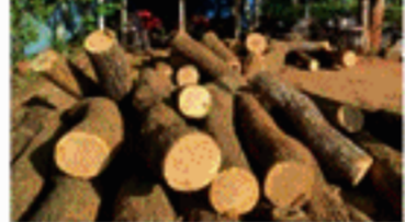
பிரிவுக்குட்பட்ட நெட்பானா பகுதியில் இருந்து, மரக் கடத்தல் முயற்சிகள் இடம்பெறுவதாக, புதுக்குடியிருப்பு பொலிஸ் பொறுப்பதிகாரிகளுக்கு கிடைக்கப்பெற்ற இரகசியத் தகவலையடுத்து, எந்தலத்துக்கு விளர்த்த பொலிஸார், மரக்குற்றிகளை மீட்டினதுடன், சந்தேகப்பர் ஒருவரையும் கைது செய்துள்ளனர்.