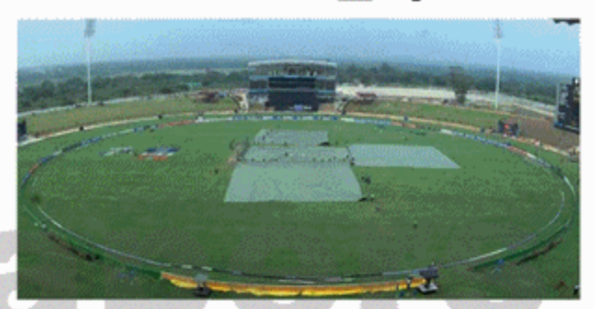
முடியாமலுள்ளது. அந்தவகையில், இரண்டு அணிகளுக்கும் இடையிலான முதலாவது இரு தரப்புத் தொடரானது இவ்வாண்டு செப்டெம்பர் முதலாம் திகதி முதல் ஐந்தாம் திகதி வரை நடைபெறவுள்ளது.

ஆங்கானிஸ்தான், பாகிஸ்தானுக்கு இடையிலான மூன்று போட்டிகள் கொண்ட ஒருநாள் சர்வதேசப் போட்டித் (ODI) தொடரானது ஹும்பாந்தோட்டையில் நடைபெறவுள்ளது. முதலில் ஐக்கிய அரபு அமீரகத்திலேயே இத்தொடர் நடைபெறுவதாக இருந்தது. இந்நிலையில், இரண்டாவது பகுதி இத்தியன் பிரிமியர் லீக்கானது இவ்வாண்டு டெட்டெம்பர் மாதம் 20ஆம் திகதி ஆரம்பமாகவதாக இருக்கின்ற நிலையிலேயே அங்கு போட்டிகளை நடத்த