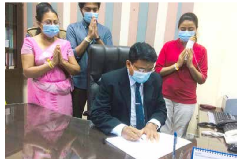
பிரதம செயலாளராக நியமிக்கப்பட்டமைக்கு அரசியல் தரப்புக்கள் கும் எதிர்ப்பை

சிங்கள இனத்தைச் சேர்ந்த ஒருவர் வடக்கு மாகாணத்துக்கு