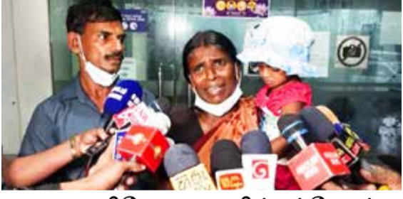
மரண பரிசோதனையில் சந்தேகம்: ஹிஷாலினியின் பெற்றோர் ஆணைக்குழுவில் முறையீடு

தவறவிடவேண்டாம் என வேண்டுகோள் யாழ்ப்பாணம், ஜூலை 27 இலங்கைத் தேர்தல்கள் ஆணையம் புதிய வாக்காளர்களாகத் தகுதி பெற்றுள்ளவர்கள் தங்கள் பெயர்களைத் தேருநர் இடாப்பில் சேர்த்துக் கொள்வதற்கான பதிவுகளை யூலை 30ஆம் திகதிக்கு முன்னர் மேற்கொள்ளவேண்டும் என அறி வித்துள்ளது. 15