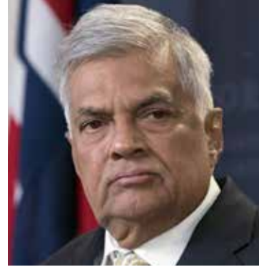
நாட்டுக்கு அவசியம் என்றும் அவர் வலியுறுத்தினார்.

மேலும் சீனா, ஜப்பான் மற்றும் ஐரோப்பிய நாடுகள் போன்ற பல நாடுகளைப் போலவே அரசமைப்பால் பாதுகாக்கப்படும் பொதுவான கொள்கைகள்