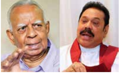
இருக்கின்றார் என்ற தகவல் வெளியாகியுள்ள நிலையில், அந்த நியமனத்தை 15

யக் கூட்டமைப்பின் தலைவர் இரா.சம்பந்தன் எம்.பி. கோரிக்கை விடுத்துள்ளார். யாழ்ப. மாவட்டத்துக்குத் தமிழ் பேச முடியாத ஒருவர் அரச அதிபராக நியமிக்கப்பட