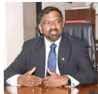
பிட்டார். இருப்பினும் தற்போது நாட்

குறிப்பாக நாட்டுக்கு மிகவும் தேவையான அந்நிய செலாவணியைக் கொண்டு வந்த சுற்றுலாத் துறை, கொரோனா காரணமாக பதிப்படைந்தது என்றும் குறிப்பிட்டார்.