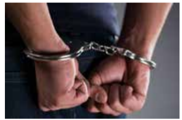
குறித்த சம்பவத்துடன் தொடர்புடையதாக மூவர் கைது செய்யப்பட்டுள்ளனர். இவ்வாறு கைது செய்யப்பட்ட மூவரும் காங்கேசந்துறை கடற்படை முகாமில் ஒப்படைக்கப்பட்டுள்ளதாக கடற்படை தரப்பில் தெரிவிக்கப்பட்டுள்ளது.

யாழ்ப்பாணம், ஜூலை 27 சட்டவிரோதமான முறையில் கடத்திவரப்பட்ட 245 கிலோ கேரள கஞ்சாவுடன் வடமராட்சி கடற்பரப்பில் வைத்து கடற்படையினரால் மூவர் கைது செய்யப்பட்டுள்ளனர். கடற்படையினர் மேற்கொண்ட வழக்கமான கடல் சுற்றுக்காவல் நடவடிக்கையின் போது, கடல் வழியாக சட்டவிரோதமான முறையில் மேற்கொள்ளப்பட்ட கடத்தல் முயற்சி முறியடிக்கப்பட்டுள்ளது. இதன்போது, கடத்தி வரப்பட்ட 245 கிலோ கேரள கஞ்சா பறிமுதல் செய்யப்பட்டதுடன்