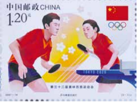
டோக்கியோ 2020 ஒலிம்பிக் ரூபாய்க்கார்த்தமாக சீனா இரு தபால் முத்திரைகளை வெளியிட்டது.