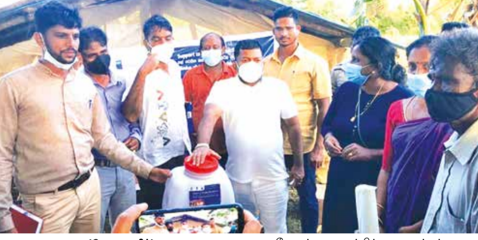
கதிரவெளி கிராமசேவகர் பிரிவுக்குட்பட்ட கல்லரிப்பு விவசாய கிராமத்திற்கு விஜயம் செய்த மட்டக்களப்பு மாவட்ட நாடாளுமன்ற உறுப்பினரும், மாவட்ட ஒருங்கிணைப்புக் குழு இணைத்தலைவருமான சிவநேசதுரை சந்திரகாந்தன், சுய உற்பத்தியில் ஈடுபடும் முயற்சியாளர்களை ஊக்கப்படுத்தும் முகமாக தெரிவுசெய்யப்பட்ட சுய உற்பத்தி மற்றும் விற்பனையாளர்களுக்கு நீர்ப் பம்பிகள் மற்றும் மோட்டார் சைக்கிள்கள் போன்றவற்றினை வழங்கி வைத்திருந்தார். அதன் பின்னர் நீடித்த மீள்கூடியேற்றத்திற்கான உதவித் திட்டத்தின் கீழ், இலங்கை மற்றும் ஐக்கிய நாடுகள் இணைந்த செயற்றிட்டத்தினூடாக காவியா பெண்கள் அமைப்பினால் ஏற்பாடு செய்யப்பட்ட

கரையோரப் பாதுகாப்பிற்கான மரக்கன்றுகளை நட்டும் வேலைத்திட்டத்தினையும் ஆரம்பித்து வைத்திருந்தார். அதனைத் தொடர்ந்து வாகரை பிரதேசத்தில் உள்ள கிருபிச்சை மற்றும் மதுரங்கேணிக்ளும் போன்ற பகுதிகளுக்கும் விஜயம்செய்து, அங்குள்ள மக்களை சந்தித்து, அவர்களுடைய குறைகளை கேட்டறிந்ததுடன், அவற்றை நிவர்த்திசெய்வதற்கு தேவையான நடவடிக்கைகளை மேற்கொள்ளுமாறு உரிய அதிகாரிகளுக்கு பணிப்புரையும் விடுத்திருந்தார். அதனடிப்படையில் அப்பிரதேசத்தில் மிக விரைவாக தேவையான அத்தியாவசிய விடயங்கள், நாடாளுமன்ற உறுப்பினரும், மாவட்ட ஒருங்கிணைப்பு குழு இணைத் தலைவருமான சிவநேசதுரை சந்திரகாந்தனும் பூர்த்திசெய்யப்பட்டுள்ளன.