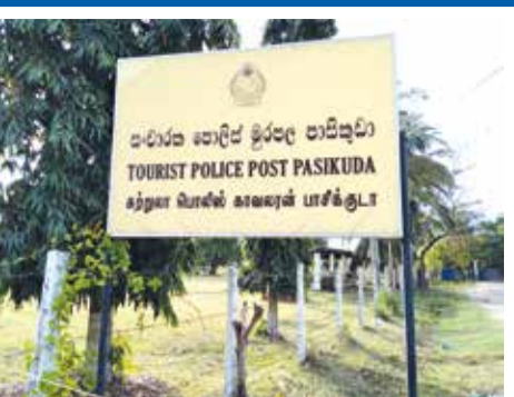
கிழக்கு மாகாணத்தில் சுற்றுலாப் பயணிகளை கவர்ந்த இடமான பாசிக்குடா

கடற்கரைக்கு உள்ளூர் மற்றும் வெளியூர் சுற்றுலாப் பயணிகள் செல்லத் தடை விதிக்கப்பட்டுள்ளது. நாட்டில் ஏற்பட்டுள்ள கொரோனா தொற்று காரணமாகவே குறித்த கடற்கரைக்கு சுற்றுலாப் பயணிகள் செல்வதற்கு தற்காலிகமாக தடைவிதித்துள்ளதாக பாசிக்குடா சுற்றுலா காவலரன் பொலிஸார் தெரிவித்தனர். குறித்த கடற்கரைப் பகுதிக்குள் எவரும் செல்லாத வகையில் தடைவிதித்து பொலிஸார் கடமையில் ஈடுபட்டு வருகின்றனர். இதனால், இக்கடற்கரைக்கு வரும் சுற்றுலாப் பயணிகள் ஏமாற்றத்துடன் திரும்பிச் செல்கின்றமை குறிப்பிடத்தக்கது.