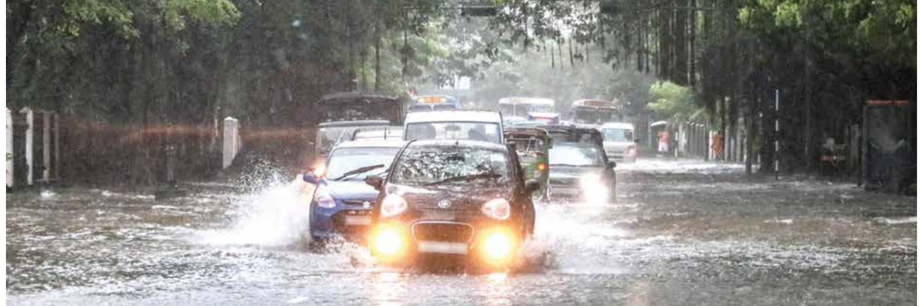
கொழும்பில் நேற்று பெய்த அடைமழை காரணமாக குமாரதுங்க முனிதாஸ மாவத்தையில் வெள்ளம் ஏற்பட்டதுடன், வாகன சாரதிகள் பெரும் சிரமங்களை எதிர்நோக்கினர்.

நாட்டில் மேல், சப்ரகமுவ, மத்திய மாகாணங்கள், காலி மற்றும் மாத்தறை ஆகிய மாவட்டங்களிலும் இன்று மழை அல்லது இடியுடன் கூடிய மழை பெய்யக்கூடும் என வளிமண்டல திணைக்களம் எதிர்வு கூறியுள்ளது. அதேபோன்று வடமாகாணத்திலும் அவ்வப்போது மழை பெய்யக்கூடும் எனவும் கூறியுள்ளது. ஊவா மாகாணத்தில் அம்பாறை மற்றும் மட்டக்களப்பு மாவட்டங்களில் அதிகாலை அல்லது இரவுநேரத்தில் மழை அல்லது இடியுடன் கூடிய மழை பெய்யக்கூடும் எனவும் எதிர்வு கூறியுள்ளது. மத்திய, வடக்கு, வடமத்திய மற்றும் வடமேல் மாகாணங்களிலும் அம்பாந்தோட்டை மற்றும் திருகோணமலை மாவட்டங்களிலும் 40 - 50 மில்லிமீற்றர் மழை பெய்யக்கூடும் என்பதோடு, இடையிடையே 60 மில்லிமீற்றர் மழையும் பெய்யக்கூடும் எனவும் வளிமண்டல திணைக்களம் எதிர்வு கூறியுள்ளது.