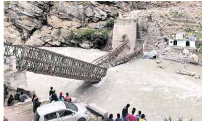
கவலைக்கிடமாக இருப்பதால் உயிரிழப்பு அதிகரிக்கக்கூடும் என அஞ்சப்படுகிறது. இதனிடையே, இந்தப் பாறைகள் விழுந்ததில் அங்கிருந்த ஆற்றுப்பாலம் இடிந்து தரைமட்டமானது. இதனால் அப்பகுதியில் போக்குவரத்து பெரிதும் பாதிக்கப்பட்டுள்ளதாக இமாச்சல் அரசு தெரிவித்துள்ளது.

இமாச்சலப் பிரதேசத்தில் நேற்றுமுன்தினம் ஏற்பட்ட பயங்கர மண்சரிவில் சிக்கி 9 சுற்றுலாப் பயணிகள் உயிரிழந்தனர். இமாச்சலப் பிரதேச மாநிலம் கின்னோர் மாவட்டத்தில் உள்ளது சங்லா பள்ளத்தாக்கு. இங்கு கடந்த சில தினங்களாக பலத்த மழை பெய்துவருவதால், மலைப் பகுதிகளில் மண்சரிவு ஏற்படக்கூடும் என வானிலை ஆய்வு மையம் அண்மையில் எச்சரித்திருந்தது. இந்நிலையில், நேற்றுமுன்தினம் அங்குள்ள மலைப்பகுதியில் பயங்கர மண்சரிவு ஏற்பட்டது. இதில் அங்கிருந்த நூற்றுக்கணக்கான பெரிய பாறைகளும் சரிந்து விழுந்தன. அப்போது, மலை அடிவாரத்திலிருந்த சுற்றுலாப் பயணிகளின் காரர்கள் மீது பாறைகள் விழுந்ததில் 9 பேர் சம்பவ இடத்திலேயே உடல் நசுங்கி பரிதாபமாக உயிரிழந்தனர். 20இற்கும் மேற்பட்டோர் படுகாயமடைந்துள்ளனர். அவர்கள் அருகிலுள்ள வைத்தியசாலையில் சேர்க்கப்பட்டுள்ளனர். அவர்களில் சிலரது நிலைமை