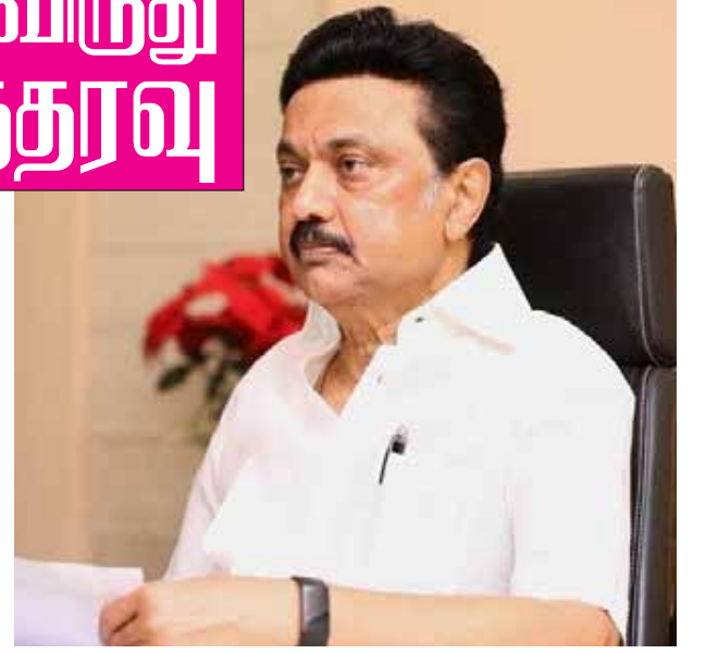
பாராட்டுச் சான்றிதழும் சுதந்திர தின விழாவின் போது முதலமைச்சர் மு.க.ஸ்டாலினால் வழங்கப்படும் என்று தெரிவிக்கப்பட்டுள்ளது.

விருதை உருவாக்க முதலமைச்சர் மு.க.ஸ்டாலின் ஆணையிட்டுள்ளார். மேற்படி விருதிற்கான விருதாளரைத் தேர்வு செய்யும் பொருட்டு, தொழில் துறை, தமிழ் ஆட்சி மொழி மற்றும் தமிழ்ப் பண்பாட்டுத் துறை அமைச்சர் மற்றும் தலைமைச் செயலாளரை உள்ளடக்கிய ஒரு குழுவை அமைக்கவும் அவர் ஆணையிட்டுள்ளார். ஒவ்வொரு ஆண்டும் தேர்வுசெய்யப்படும் "தகைசால் தமிழர்" விருது பெறும் விருதாளருக்கு ரூபா.10 லட்சத்திற்கான காசோலையும்