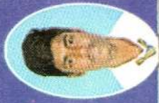
P. INPAN 9A