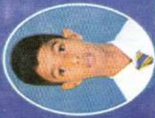
J. ORISHJEMS 9A