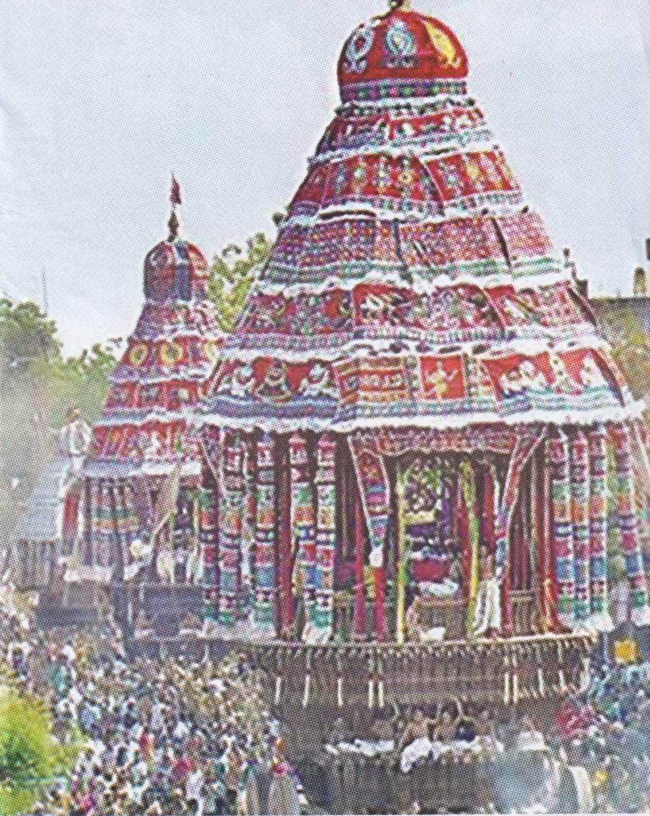
சிதம்பரம் தேர் - ஆனித்திருமஞ்சளம்