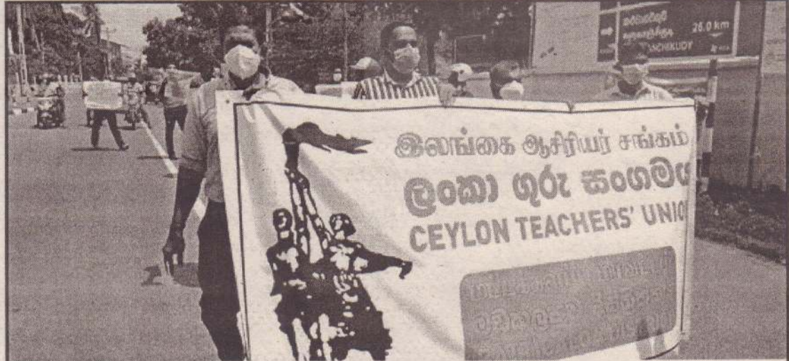
பல்கலைக்கழக ஆணைக்குழுவை சுயாதீனமாகவும் அதிகாரம் மிக்கதாகவும் மாற்றி "கொத்தலாவல பாதுகாப்பு பல்கலைக்கழக சட்டத்தை கிழித்தெறி" எனும் தொனிப்பொருளில் நேற்று மட்டக்களப்பில் மாபெரும் கண்டனப் பேரணி இடம்பெற்றது.

அரசாங்கத்தினால் அனுமதி வழங்கப்படவில்லை. மேலும் டொலர் பற்றாக்குறை நிலவுகின்ற நிலையில் கடன் உறுதி கடிதத்தை திறப்பதற்கு தடை விதிக்கப்பட்டுள்ளமையினால் லாப்ஸ் எரிவாயு நிறுவனம் இறக்குமதி செய்வதில் பிரச்சினையை எதிர்நோக்கியுள்ளதாக அறிவித்திருந்தது. (நி-5)