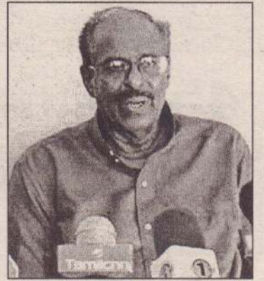
நாமும் வற்புறுத்துகிறோம் எனவும் தெரிவித்தார்.

மேலும் அவர் ஆசிரிய சமூகம், மாணவ சமூகம் மட்டுமல்ல அரசியல் அமைப்புக்கள் அனைத்தும் ஒன்றுபட்டு. இன்றைய அரசை, ஆசிரிய சமூகத்தினதும் பல்கலை. மாணவர் சமூகத்தினதும் கோரிக்கைகளை நிறைவேற்ற வற்புறுத்த வேண்டும் எனவும் அத்துடன் பொருத்தமான ஜனநாயக நடவடிக்கைகளை எடுக்க