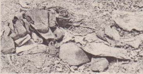
(கிளிநொச்சி) கிளிநொச்சி - விளாவோடை வயல் பகுதியில் இருந்து இராணுவ சீருண்டிடன் மனித எச்சங்கள் கண்டுபிடிக்கப்பட்டுள்ளன.

குறித்த வயல் காணியை சீரமைத்த காணி உரிமையாளர் எச்சங்கள் அவதா னிக்கப்பட்டதை அடுத்து பொலிஸாருக்கு தகவல் வழங்கியுள்ளார். குறித்த எச்சங்களை கிளிநொச்சி மாவட்ட நீதிமன்ற நீதிபதி பார்வையிட்ட பின்னர் எச்சங்களை அகற்ற நடவடிக்கை எடுக்கப்படும் என்று தெரிவித்துள்ள கிளிநொச்சி பொலிஸார் மேலதிக விசாரணைகளை மேற்கொண்டு வருகின்றனர். (ம-100,316)