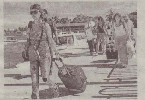
இன்னும் நடைமுறையில் உள்ளன. அவர்கள் இலக்கை அடைய சில சவால்களை எதிர்கொள்கின்றனர் எனவும் அவர் மேலும் தெரிவித்தார். (த-இ)

நவம்பர் மாதம் தொடக்கம் நாளாந்தம் சுமார் 5 ஆயிரம் சுற்றுலாப் பயணிகளை வரவழைக்கத் திட்டமிடப்பட்டுள்ளது என்று சுற்றுலாத்துறை அமைச்சர் பிரசன்ன ரணதுங்க தெரிவித்துள்ளார். புதிய சுகாதார வழிகாட்டல்களைக் கடைபிடிக்கும்போது இலக்கை அடையத் தேவையான நடவடிக்கைகளை எடுத்துள்ளோம் என்றும் அவர் தெரிவித்தார். புதிய கொரோனா சுகாதார வழிகாட்டல்களின் அடிப்படையில் சுற்றுலாப் பயணிகளை வரவழைக்க முடியும். உலகெங்கிலும் உள்ள சுற்றுலாப் பயணிகளுக்கு கட்டுப்பாடுகள்