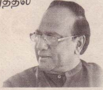
ரம் வீழ்ச்சியடைந்துள்ள நிலையில் அப்பாவி ஆசிரியர்கள் பலர் தவறாக வழிநடத்தப்பட்டுள்ளனர்- என்றார். (ம-இ)

நடவடிக்கையை எடுக்காவிட்டால் நாட்டை அபிவிருத்திசெய்ய முடியாது. அமைச்சரவையிலும் இதனைத் தெரிவித்துள்ளேன். நாட்டில் கொரோனா வைரஸ் பரவிக் கொண்டுள்ள தருணத்தில் சதிகாரர்கள் ஒரு லட்சம் பேரை ஆர்ப்பாட்டங்களுக்காக வீதிகளுக்குக் கொண்டு வந்துள்ளனர். கொரோனாப் பெருந்தொற்றுக் காரணமாக நாட்டின் பொருளாதா