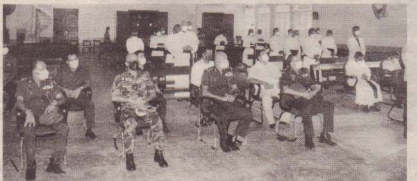
இராணுவத்தினர் மற்றும் பொலிஸார் அனைவரது நலனுக்காகவும் இந்த வழிபாடு ஒப்புக்கொடுக்கப்பட்டது. பிரார்த்தனை நிகழ்வில் யாழ்ப்பாண மாவட்ட திருச்சபைகளின் குருமார்கள், பங்குத் தந்தையர்கள் மற்றும் யாழ்ப்பாண மாவட்ட இராணுவ உயர் அதிகாரிகள் எனப்பலரும் கலந்துகொண்டனர். (ஐ-20)