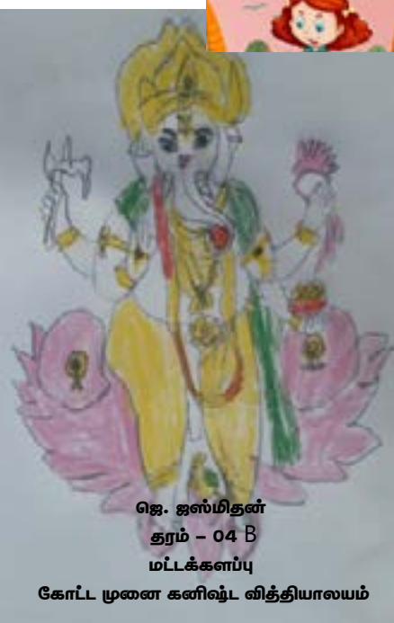
ஜெ. ஜஸ்மிதன் தரம் - 04 B மட்டக்களப்பு கோட்ட முனை கனிஷ்ட வித்தியாலம்

சி.தாரணி. தி.விபுலானந்தா கல்லூரி. திருகோணமலை.