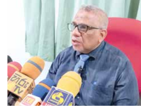
கல்முனையை பொறுத்தவரையில், கடைசியாக தடுப்பூசிகள் இங்கு கிடைக்கப்பெற்றாலும், தடுப்பூசி வழங்கப்பட எதிர்பார்ப்போரில் 40 வீதமானோருக்கு இந்த பிராந்தியத்தில் தடுப்பூசிகள் செலுத்தப்பட்டுள்ளன என்றும் தெரிவித்தார்.

பேருக்கு இரண்டாம் கட்ட தடுப்பூசியும் வழங்கப்பட்டுள்ளது. மட்டக்களப்பு பிராந்திய சுகாதாரப் பிரிவில் இதுவரை 1,74,935 பேருக்கு முதலாம் கட்ட தடுப்பூசி வழங்கப்பட்டுள்ளது. இங்கு 100,065 பேருக்கு இரண்டாம் கட்ட தடுப்பூசியும் வழங்கப்பட்டுள்ளது. திருகோணமலை பிராந்திய சுகாதாரப் பிரிவில் இதுவரை 1,50,186 முதலாம் கட்ட தடுப்பூசி வழங்கப்பட்டுள்ளது. இங்கு 24,814 பேருக்கு இரண்டாம் கட்ட தடுப்பூசியும் வழங்கப்பட்டுள்ளது. இதேபோன்று கல்முனை பிராந்திய சுகாதாரப் பிரிவில் நேற்று முன்தினம் (29) மாத்திரம் 42,846 பேருக்கு தடுப்பு ஊசி செலுத்தப்பட்டு இருக்கின்றது. மொத்தமாக இங்கு 92,846 பேருக்கு முதலாம் கட்ட தடுப்பூசி வழங்கப்பட்டுள்ளது.