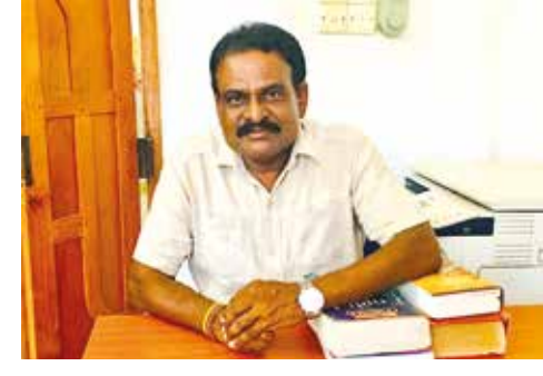
எனவே, தமிழ் மக்களைப் பொறுத்தமட்டில் சுய மரியாதை உரிமையோடு கூடிய அபிவிருத்தியை விரும்புகிறார்களே ஒழிய, கண்களை விற்று ஓவியம் வாங்கவோ அத்திவாரத்தை இடித்து கட்டடம் கட்டவோ, மரத்தின் ஆணிவேரை அறுத்து அரசியல் செய்யவோ விரும்பவில்லை. ஆகவே, தமிழ்த் தேசிய கூட்டமைப்பு நாகரிக ஜனநாயக அரசியலை முன்னெடுப்பதால் தன்மானத் தமிழர்கள் அனைவரும் தமிழ்த் தேசியக் கூட்டமைப்பின் பக்கமாக நின்று செயற்பட வேண்டும் என்றார்.

இருக்கிறோம். பேரினவாத அபகரிப்பின் கீழுள்ள திருகோணமலை மற்றும் அம்பாறை மாவட்டத்தினை மீட்க வேண்டும். அதனை விடுத்து மட்டக்களப்பு மாவட்டத்தில் மாத்திரம் போட்டியிட்டு ஒரு நாடாளுமன்ற பிரதிநிதித்துவத்தை பெற்று, கிழக்கை மீட்பது என்பது என்று மக்கள் மத்தியில் கேள்வி நிலவுகிறது. கிழக்கிலிருந்து, அம்பாறை, திருகோணமலையை கைவிட்டு விட்டார்களோ என்று எண்ணவும் தோன்றுகிறது. பேரினவாதம் அடித்தாலும், உடைத்தாலும் கூட்டமைப்புக்கு எதிராக செயற்படுபவர்களுக்கு எந்தப் பிரச்சினையும் வைத்த அரசியலாளர் தமிழ்த் கூட்டமும் வாக்கு - கிழக்கில் செயற்படுகிறது. ஏட்டிக்குப் போட்டியாக அடித்தடி, வெட்டுக்குத்து அரசியலைத் தவிர்ந்து நியாய நிதான அரசியல் முன்னெடுப்புகளை கூட்டமைப்பு மேற்கொள்கிறது.