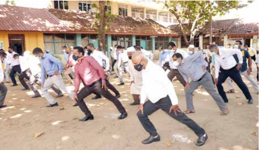
(ஏறாஜார் திருபுரர் - நாலூர்)