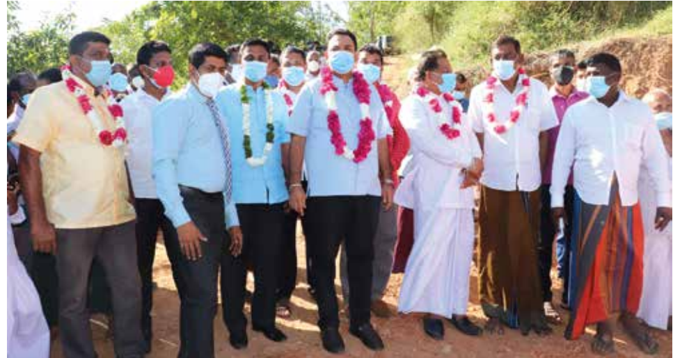
பலாங்கொடை விக்சிலிய தோட்டத்தில் வசிக்கும் சுமார் 300 இற்கும் மேற்பட்ட குடும்பங்களைச் சேர்ந்தவர்கள் நீண்ட காலமாக குடிநீரின்றி பல்வேறு சிரமங்களை எதிர்நோக்கி