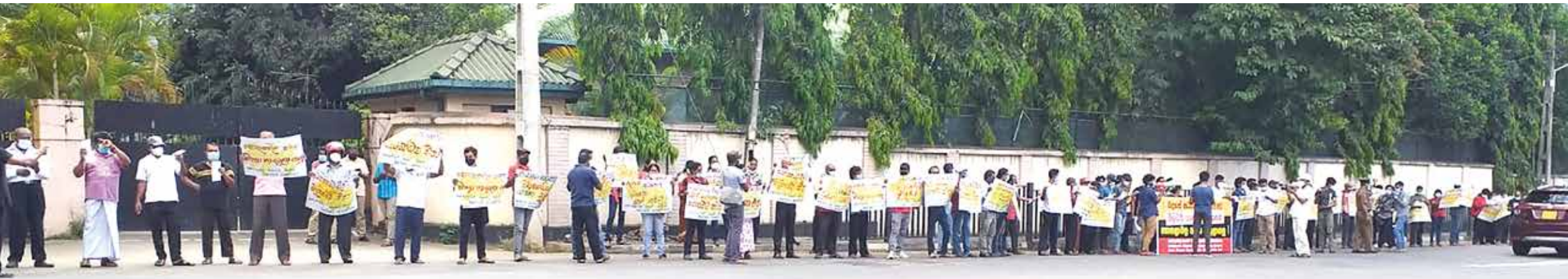
கொத்தலாவல் பல்கலைக்கழக சட்டத்திற்கு எதிர்ப்புத் தெரிவித்து நேற்று முன்தினம் பதுளை நகரில் போராட்டம் நடைபெற்றது. இந்த போராட்டமானது பதுளை பஸ் நிலையம், ஊவா மாகாண சபை, ஊவா மாகாண ஆளுநர் அலுவலகம் மற்றும் சாலையின் இருபுறமும் நடைபெற்றது.