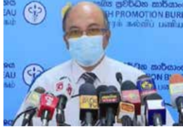
உரிய சுகாதார வழிமுறைகளைக் கடைப்பிடித்து பயணிகளை ஏற்றிச் செல்வதற்கு பொதுப்

போக்குவரத்து சேவையில் ஈடுபடுபவர்களே பொறுப்பேற்க வேண்டும் என சுகாதார அமைச்சு தெரிவித்துள்ளது.