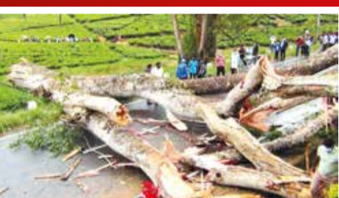
(க.கிஷோர்தன், பி. கேதீஸ்)

ஹட்டன் - நுவரெலியா பிரதான வீதியில் கொட்டகலை வைத்தியசாலைக்கு அருகில் பாரிய மரமொன்று முறிந்து விழுந்ததால் நேற்று பிற்பகல் அவ்வீதியினூடான போக்குவரத்து முற்றாக தடைப்பட்டுள்ளதாக திம்புள்ள - பத்தனை பொலிஸார் தெரிவித்தனர்.