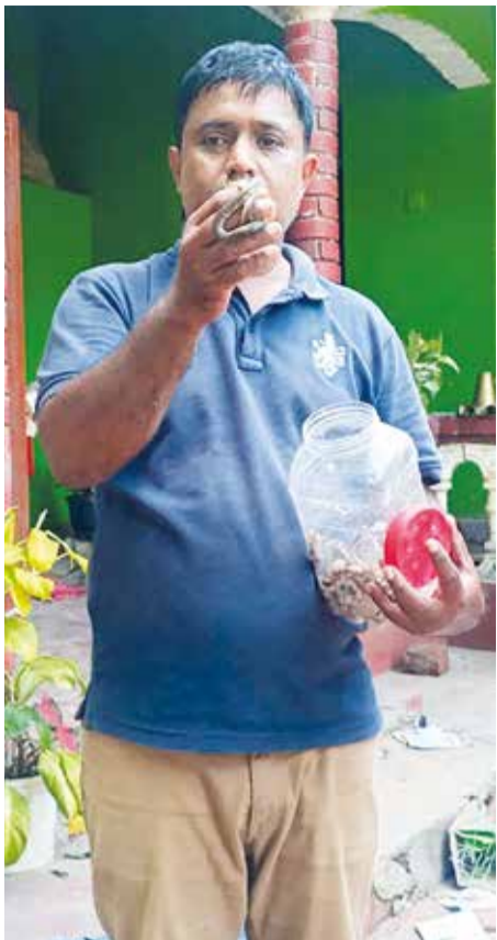
பாம்பென நம்பும் ஒரு பாம்பும் கண்டறியப்பட்டு, பாதுகாப்பாக மீட்கப்பட்டதாக சுற்றுச்சூழல் ஆர்வலர் மேலும் குறிப்பிட்டார்.

வீட்டை ஆய்வுசெய்தபோதிலும், பாம்புக்குட்டிகள் பொரித்த முட்டையின் துகள்கள் எதுவும் அங்கு இருக்கவில்லையென்றும், வீட்டின் இன்னொரு பகுதியிலிருந்து தாம்பு