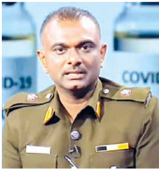
நிகழ்வுகள் மற்றும் வேறுசில நிகழ்ச்சிகளில் கலந்துகொண்டவர்களின் மத்தியில் புதிய கொத்தணி இனங்காணப்பட்டமை அதற்கு சிறந்த உதாரணமாகும். இதனால், இவ்வளவுகாலமும் அமுலில் இருந்த சுகாதார கட்டுப்பாடுகளிலிருந்து வழங்கப்பட்டுள்ள நிவாரணங்களை

கடந்த சில தினங்களில் நாட்டின் பல பிரதேசங்களில் இடம்பெற்ற திருமண