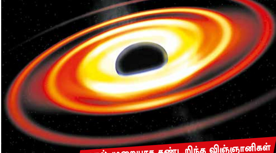
முதல் முறையாக கண்டறிந்த விஞ்ஞானிகள்