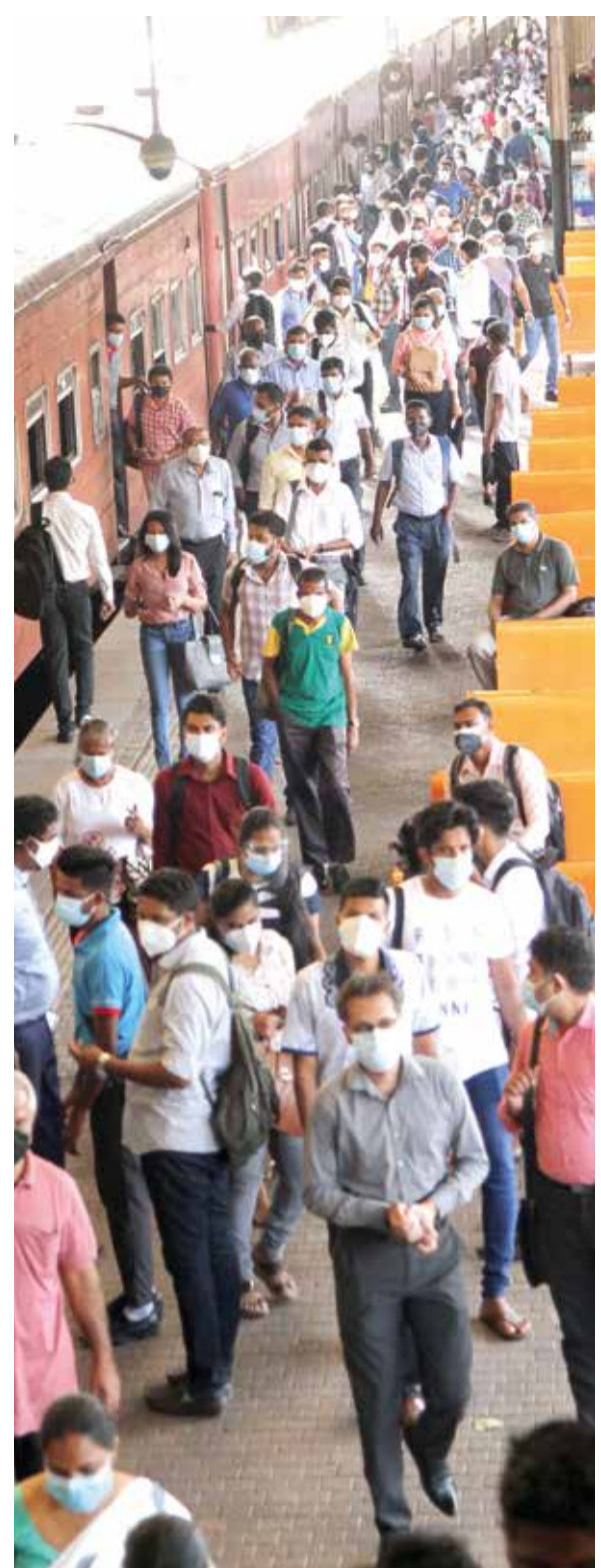
அரசாங்க ஊழியர்கள் அனைவரையும் நேற்றுமுதல் பணிக்கு சமூகம் தருமாறு அறிவிக்கப்பட்டுள்ள நிலையில், கொழும்பு கோட்டை ரயில் நிலையத்தில் பெரும் எண்ணிக்கையிலானோர் நேற்றுக்காலை வருகைத்தரத்தை படத்தில் காணலாம்.