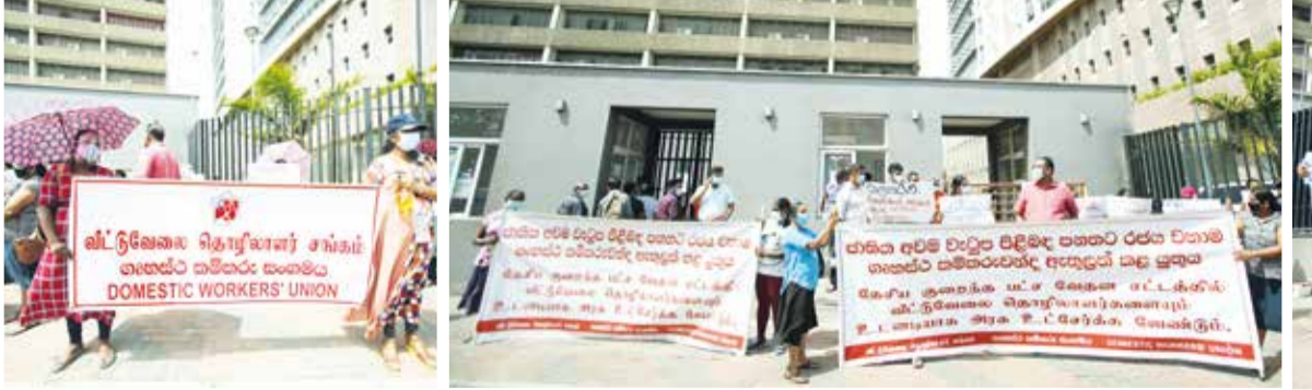
உயர்நீதிச்ச சம்பளம் தொடர்பான தேசிய சட்டத்துக்கு அரசாங்கம் உடனடியாக வீட்டுப் பணியாளர்களை இணைத்துக்கொள்ள வேண்டும் எனவும் உயிரிழந்த டயகம் சிறுமி ஹிஷாலினி விவகாரம் தொடர்பில் பக்கச்சார்பற்ற விசாரணைகள் மேற்கொள்ளுமாறும் வலியுறுத்தி வீட்டு வேலை தொழிலாளர் சங்கத்தினால் ஏற்பாடுசெய்யப்பட்ட ஆர்ப்பாட்டம் நேற்று நாளையாழ்வாரைத் தொழில் அமைச்சின் செயலாளர் அலுவலகத்தின் முன்னால் இடம்பெற்றது.

அதற்கமைய, சண்டி விப்பாய் சுகாதார வைத்திய அதிகாரி பிரிவில் 08 பேருக்கும் கரவெட்டி சுகாதார வைத்திய அதிகாரி பிரிவில் 18 பேருக்கும் உடுவில் சுகாதார வைத்திய அதிகாரி பிரிவில் 14 பேருக்கும் யாழ். போதனா வைத்தியசாலையில் 07 பேருக்கும் தெல்லிப்பழை ஆதார வைத்தியசாலையில் 03 பேருக்கும் கொரோனா தொற்று உறுதிப்படுத்தப்பட்டுள்ளது. கிளிநொச்சி மாவட்டத்தில் 03 பேர், உருத்திரபுரம் பிரதேச வைத்திய சாலையில் ஒருவர், அக்கராயன்குளம் பிரதேச வைத்தியசாலையில் ஒருவர், கிளிநொச்சி மாவட்ட வைத்திய சாலையில் ஒருவர், மன்னார் மாவட்ட வைத்தியசாலையில் 05 பேர், முல்லைத்தீவு மாவட்ட வைத்தியசாலையில் ஒருவர் முல்லைத்தீவு தனிமைப்படுத்தல் நிலையத்தில் (இராணுவத்தினர்) 06 பேர் என அடிப்படையில் தொற்று உறுதிப்படுத்தப்பட்டுள்ளது.