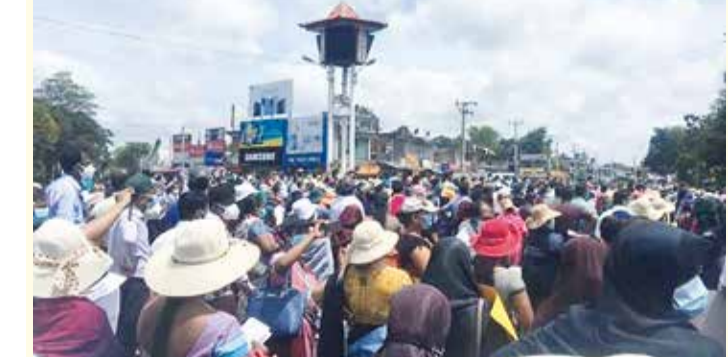
ஆசிரியர் மற்றும் அதிபர்கள் சம்பள முரண்பாட்டை நீக்க கோரியும் கொத்தலாவல் சட்டமூலத்தை இரத்துசெய்யக் கோரியும் ஆசிரியர்களால் முன்னெடுக்கப்பட்ட ஆர்ப்பாட்டம் நேற்று அனுராதபுரம், கெக்கிராவ நகரில் இடம்பெற்றது. (படங்கள் : அனுராதபுரம்)