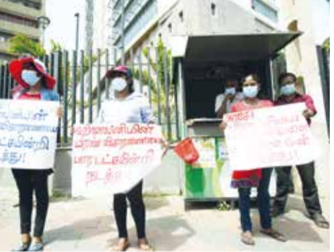
உயர்நீதிச்ச சம்பளம் தொடர்பான தேசிய சட்டத்துக்கு அரசாங்கம் உடனடியாக வீட்டுப் பணியாளர்களை இணைத்துக்கொள்ள வேண்டும் எனவும் உயிரிழந்த டயகம் சிறுமி ஹிஷாலினி விவகாரம் தொடர்பில் பக்கச்சார்பற்ற விசாரணைகள் மேற்கொள்ளுமாறும் வலியுறுத்தி வீட்டு வேலை தொழிலாளர் சங்கத்தினால் ஏற்பாடுசெய்யப்பட்ட ஆர்ப்பாட்டம் நேற்று நாளையாழ்வாரைத் தொழில் அமைச்சின் செயலாளர் அலுவலகத்தின் முன்னால் இடம்பெற்றது.