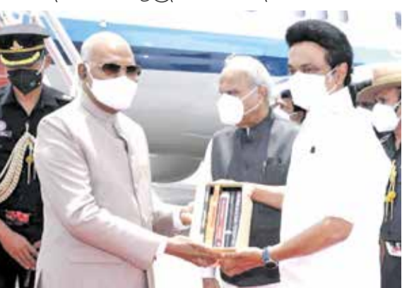
குடியரசுத் தலைவருக்கு புத்தகங்களை பரிசளித்த முதலமைச்சர் ஸ்டாலின்...

குடியரசுத் தலைவர் வருகையை முன்னிட்டு சென்னை விமான நிலையம், ஆளுநர் மாளிகை, தலைமைச் செயலக