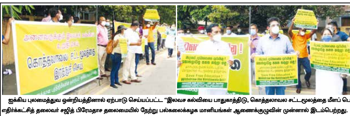
ஐக்கிய புலமைத்துவ ஒன்றியத்தினால் ஏற்பாடு செய்யப்பட்ட "இலவச கல்வியை பாதுகாத்திடு, கொத்தலாவல் சட்டமூலத்தை மீள் பெறு" எனும் தொனிப்பொருளினான எதிர்ப்பு ஆர்ப்பாட்டம் எதிர்க்கட்சித் தலைவர் சஜித் பிரதேச தலைமையில் நேற்று பல்லைக்க்கழக மாணியங்கள் ஆணைக்குழுவினர் முன்னால் இடம்பெற்றது.