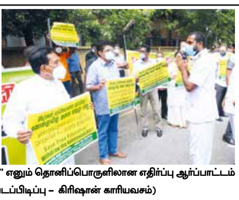
ஐக்கிய புலமைத்துவ ஒன்றியத்தினால் ஏற்பாடு செய்யப்பட்ட "இலவச கல்வியை பாதுகாத்திடு, கொத்தலாவல் சட்டமூலத்தை மீள் பெறு" எனும் தொனிப்பொருளினான எதிர்ப்பு ஆர்ப்பாட்டம் எதிர்க்கட்சித் தலைவர் சஜித் பிரதேச தலைமையில் நேற்று பல்லைக்க்கழக மாணியங்கள் ஆணைக்குழுவினர் முன்னால் இடம்பெற்றது.