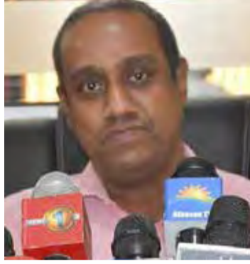
சுகாதார மருத்துவ அதிகாரி அலுவலகத்தில் தடுப்பூசியின் இரண்டாவது டோஸ் வழங்கப்படவுள்ளது.

நானாட்டான் சுகாதார வைத்திய அதிகாரி பிரிவில் இன்று திங்கட்கிழமை காலை 8 மணி முதல் வங்காலை புனித ஆனாள் தேவாலயத்திலும், நாளை செவ்வாய்க்கிழமை காலை 8 மணி முதல் நண்பகல் 12 மணி வரை நானாட்டான் டிலாசால் பாடசாலையிலும், பிற்பகல் 1.30 மணி முதல் 4 மணி வரை முருங்கனில் அமைந்துள்ள நானாட்டான்