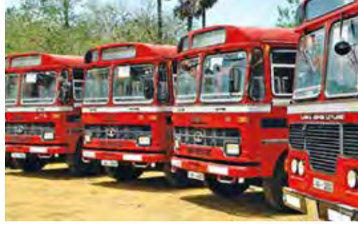
யாழ்ப்பாணம், ஓக. 09