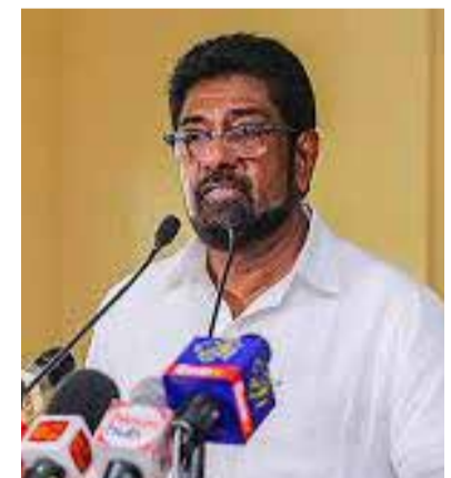
ணப்பிக்க முடியும். இவ்வாறானவர்களுக்கு வழங்குவதற்காக ஒரு தொகை தடுப்பூசிகள் ஒதுக்கப்பட்டுள்ளன எனக் குறிப்பிட்டுள்ளார்.

குறிப்பிட்ட சில நாடுகள் சில தடுப்பூசிகளை ஏற்றுக் கொள்ளவில்லை என்று தெரிவிக்கப்பட்டுள்ளது. இவ்வாறான நாடுகள் சில தடுப்பூசிகளை ஏற்றுக்கொண்டுள்ளன. இந்த குறிப்பிட்ட நாடுகளுக்கு உயர் கல்வியைத் தொடர்வதற்காக, வியாபார நடவடிக்கைகளுக்காக அல்லது பிள்ளைகளின் கற்றல் செயற்பாடுகளுடன் தொடர்புடைய நிகழ்வுகளில் பெற்றோர் கலந்துகொள்வதற்காக செல்ல வேண்டியேற்படும். அவ்வாறானவர்கள் உரிய ஆவணங்களை வெளிநாட்டிலுள்ளவர்கள் அமைச்சர் சமர்ப்பித்து தாம் செல்லவுள்ள நாடுகளில் அங்கீகரிக்கப்படுகின்ற தடுப்பூசியைப் பெற்றுக்கொள்ள முடியும். இணையவழியூடாக இதற்கு விண்