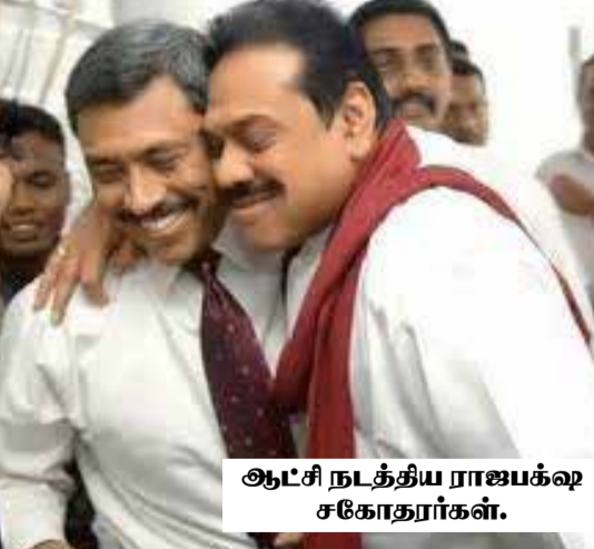
ஆட்சி நடத்திய ராஜபக்ஷ சகோதரர்கள்.

போர் முடிந்தாலும் இனப்பிரச்சினைக்கு தீர்வு என்பது இலகுவானதல்ல என்ற எனது உணர்வில் அவரை சர்வதேச ஆளுமை உள்ளவராக பதவியி