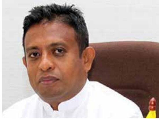
பிட்டுக் கொள்ள வேண்டும். கொவிட்தொற்றாளர்கள் குறைந்தளவு

மூளை பகுதியில் மரணித்துள்ள அதிகாரிகளால் நாடு நிர்வகிக்கப்பட்டால் இனி வரும் காலங்களில் நாட்டு மக்கள் பல சவால்களை எதிர்கொள்ள நேரிடும் என்பதை உறுதியாகக் குறிப்பிட்டுக் கொள்ள வேண்டும்.