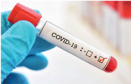
கொரோனாத் தொற்று இருப்பது கண்டறியப்பட்டது. மேலும், இவர்களின் சிலருக்கு தமது வீடுகளுக்குச் சென்ற பின்னர் காய்ச்சல் ஏற்பட்டதாகவும், தெரியவந்துள்ளது. இத்திட்டத்தில் கலந்துகொண்ட சுமார் 70 பேர் தத்தமது வீடுகளில் தனிமைப்படுத்தப்பட்டுள்ளனர்.

■ களாள ஓவ்வன் மட்டக்களப்பு, சத்துருக்கொண்டாவில், கிழக்கு மாகாண விவசாயத் திணைக்களத்தின் ஏற்பாட்டில், கடந்த 2 ஆம் திசை திணைக்களத்தின் கள உத்தியோகத்தர்களுக்கான 5 நாட்கள் கொண்ட செலவழிவோன்று நடைபெற்றுத் துவங்கியது. இத்திட்டத்தின் கீழ், இதுதான் நடைபெற்று இச்செயலமர்வில் 168 பேர் கலந்துகொண்டதாகவும், இதனை கிழக்கு மாகாண ஆளுநர் ஆரம்பித்துவைத்தார் எனவும் தெரிவிக்கப்பட்டுள்ளது. இத்திட்டத்தில், இச்செயலமர்வில் இறுதி நாளின்போது அங்கு சென்ற பொதுக் காகதார அதிகாரிகள் மேற்கொண்ட அண்டிஜன் பரிசோதனையில் சிலருக்குக்