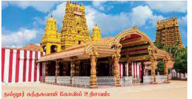
நல்லூர் கந்தசுவாமி கோவில் உற்சவம்:

காத்தான்குடி, பொலிஸ் பிரிவில் கடந்த ஜூன் மாதத்தில் மாதந்திரம் 41 பேர் ஜூன், ஜூலை மாதங்களில் போளாப்பொருள்களை வைத்திருந்த குற்றச்சாட்டில் கைது செய்யப்பட்டுள்ளனர் எனப் பொலிஸார் தெரிவித்தனர். இம்மாதம் இதுவரைக்குமான கைது செய்யப்பட்டுள்ள 10 பேர் இக்குற்றச்சாட்டில் சந்தேகதரர்களாக கைது செய்யப்பட்டுள்ளனர். இவர்களில் போளாப்பொருள் விற்பனையாளர்களும் அடங்குவதாகக் கூறப்பட்டுள்ளது. பொலிஸ் நிலையத் தகவல்கள் தெரிவிக்கின்றன.