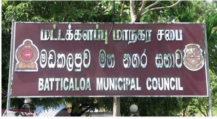
மேலும், பொதுமக்கள் தங்களது ஊடாக தகவல்களைப் பெற்றுக்கொள்ள முடியும் எனவும் அலுவலர் தெரிவித்தார்.