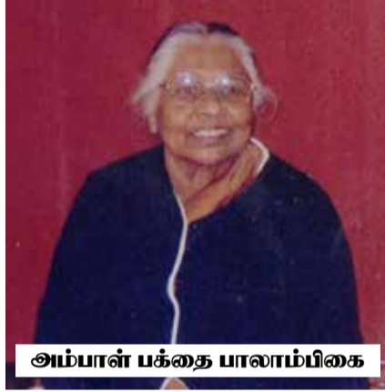
அம்பாள் பக்தை பாலாம்பிகை

ஒருநாள் நாம்வாழ்ந்த சங்குவேலி கிரா மத்தை காலவேளை அவர்கள் சுற்றி வளைத்தனர். அவ்வாறான சுற்றிவளைப் பின்போது அறைல் கேட்கும், தாக்குதல், கைது என்பன இடம்பெறலாமென்ற அச்ச வுணர்வு மக்களிடையே காணப்படும். எங்கள் கிராம சுற்றிவளைப்பின் போது அமைதி காக்கும் படையினர் எங் கள் வீட்டிலும் தேடுதல் நடவடிக்கையை மேற்கொண்டனர். வாயிலூடாக நுழை யாமல், வளவின் பின்புறவேலிகளைத் தாண்டி பாரிய சத்தம் எழுப்பியவாறு வந் தனர். அவர்களின் குரலில், நடவடிக்கை களில் மூர்க்கம், சீற்றம் காணப்பட்டன.