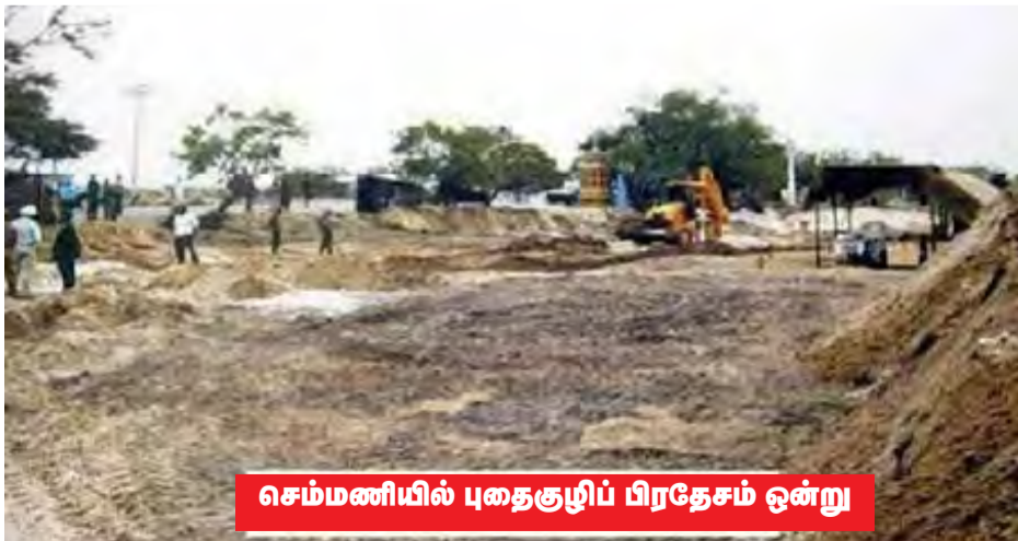
செம்மணியில் புதைகுழிப் பிரதேசம் ஒன்று