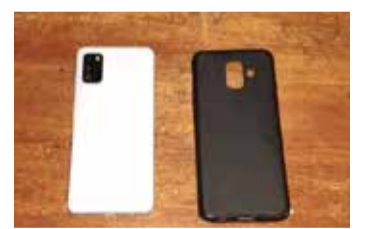
புடைய இருவரைச் சங்காணைப் பகுதியில் யாழ்ப்பாணம் மாவட்ட பொலிஸ் புலனாய்வுப் பிரிவினர் கைதுசெய்துள்ளதுடன் தொலைபேசியையும் மீட்டு மானிப்பாய் பொலிஸாரிடம் ஒப்படைத்துள்ளனர். (இ - 03)

சண்டிலிப்பாய் சீரணி அம்மன் கோயிலுக்கு அருகாமையில் உள்ள கடை ஒன்றில் கடந்த வாரம் தொலைபேசி திருடப்பட்டது. குறித்த தொலைபேசி திருட்டுச் சம்பவத்துடன் தொடர்