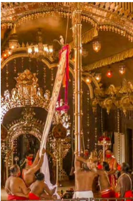
வரலாற்றுப் பிரசித்திபெற்ற நல்லூர் கந்தசுவாமி ஆலயத்தின் கொடியேற்றம் நேற்று இடம்பெற்ற போது...