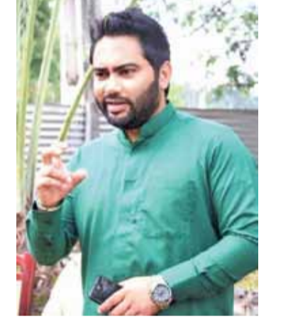
எனினும் முடியுமானவரை இவ்வலயத்தைக் கவனத்தில் கொண்டு நடவடிக்கை எடுப்பதாகவும் இதன் போது செயலாளர் தெரிவித்தார்.