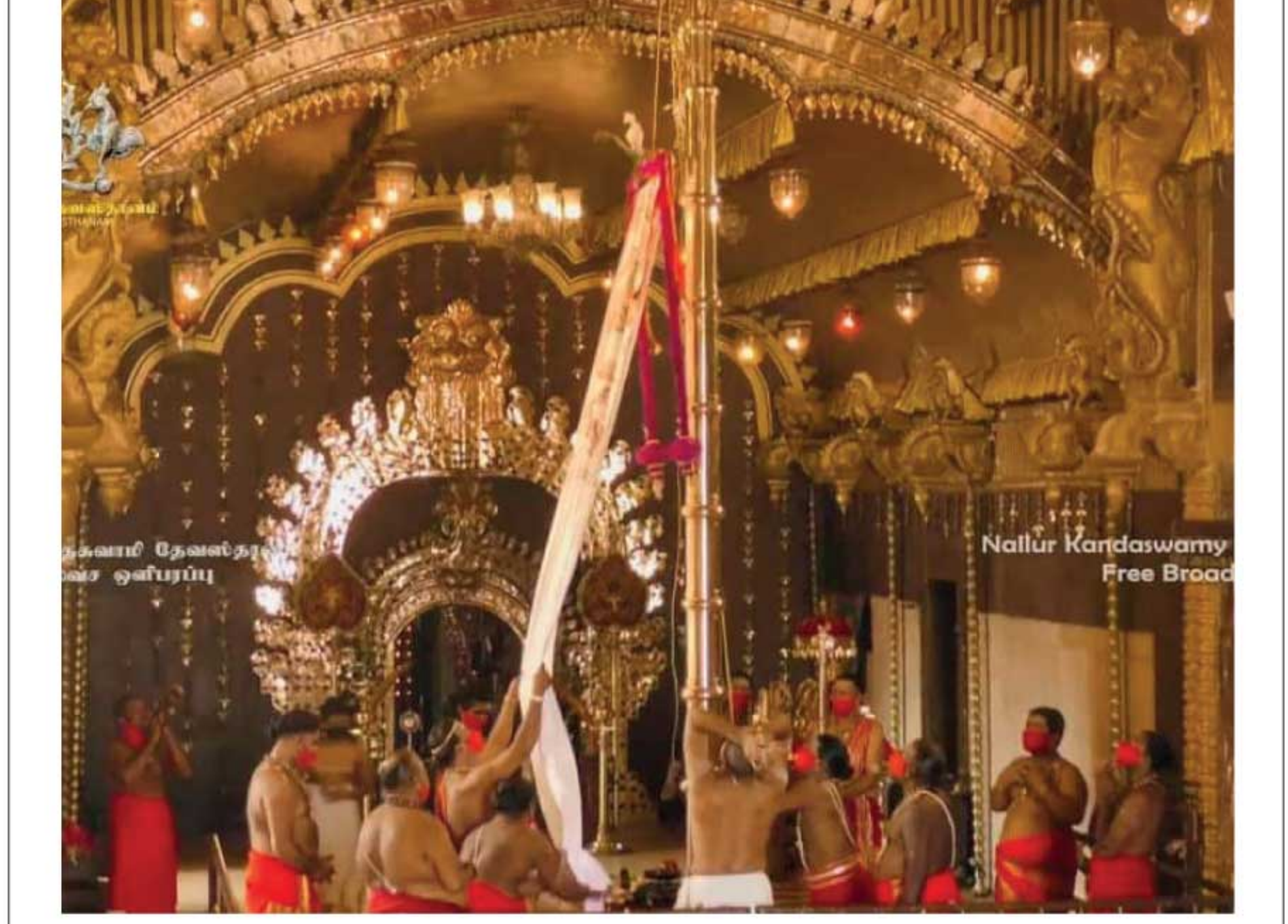
நல்லூர் கந்தசுவாமி கோவில் வருடாந்த மஹோற்சவம் நேற்று (13) கொடியேற்றத்துடன் ஆரம்பமானது. சுகாதார நடைமுறைகளுக்கு ஏற்ப மட்டுப்படுத்தப்பட்ட பக்தர்களை கொண்டே திருவிழா நடைபெறவுள்ளமை குறிப்பிடத்தக்கது. (என். ராஜ், எம். ரொசாந்த்)