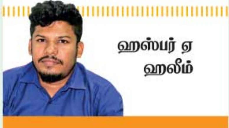
ஹஸ்பர் ஏ ஹலீம்

கிழக்கு மாகாணம் இயற்கை வளங்களால் அழகு பெறும் ஒரு மாகாணம். அதில் திருகோணமலை மாவட்டமும் இயற்கையினை மேலும் அழகு பெறச் செய்கிறது. சுற்றுலாத் தளங்களின் ஒரு பகுதியாக புல்மோட்டை அரிசி மலை காணப்படுகிறது.