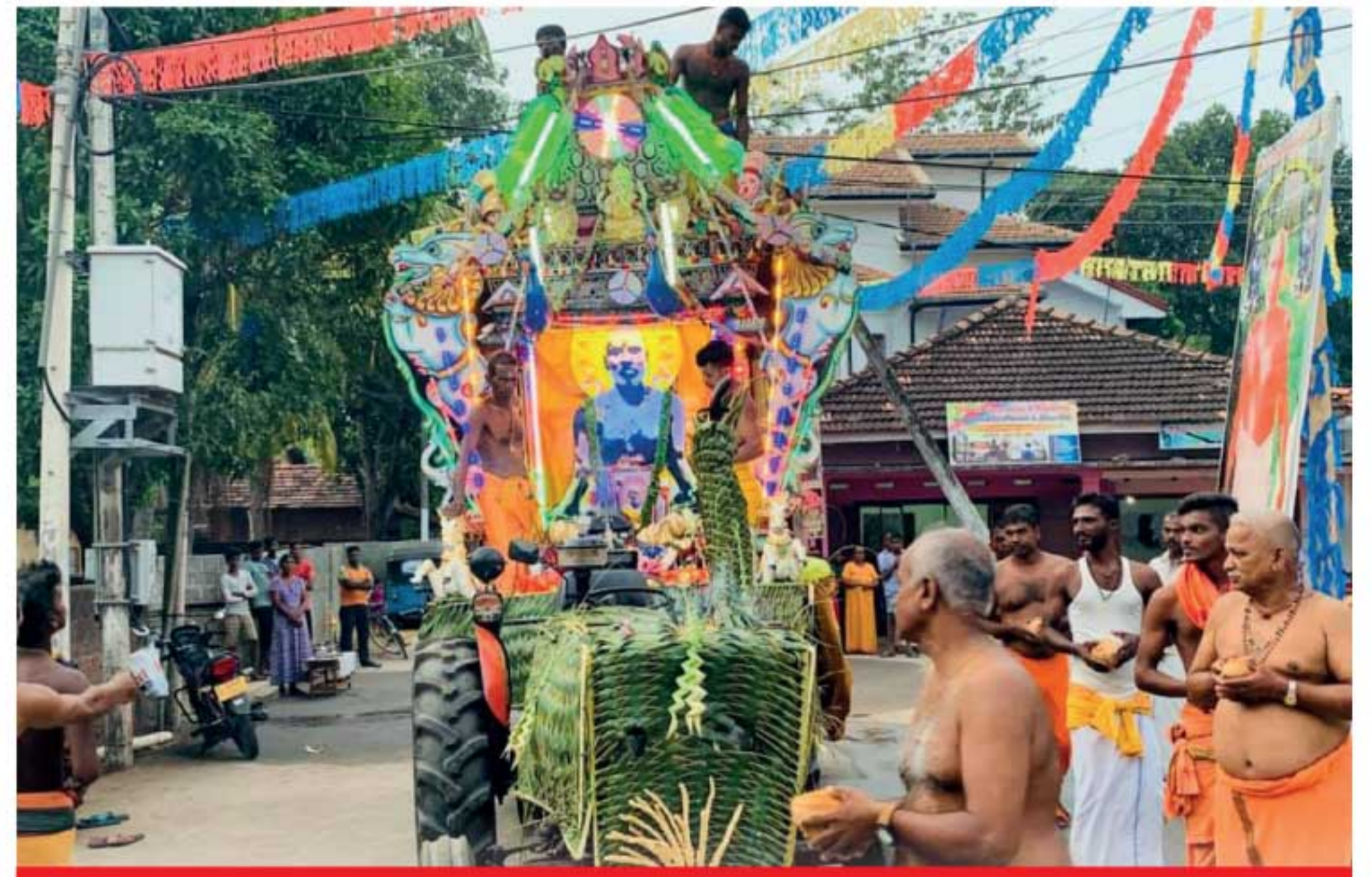
கல்முனையில் இருந்து கதிர்காமத்தில் எரிந்த நெருப்பை அணைத்த சித்து விளையாட்டு

அத்துடன், செலவுகள் அதிகரிக்கும் போது விலையேற்றமும் இயல்பானதே ஆகவே, இரண்டும் ஒன்றிலொன்று தங்கியிருப்பதால் எவருக்கும் பாதிப்பை ஏற்படுத்தாத வகையில் நடவடிக்கைகளை சம்பந்தப்பட்ட தரப்பினர் எடுப்பதே சிறந்தது.