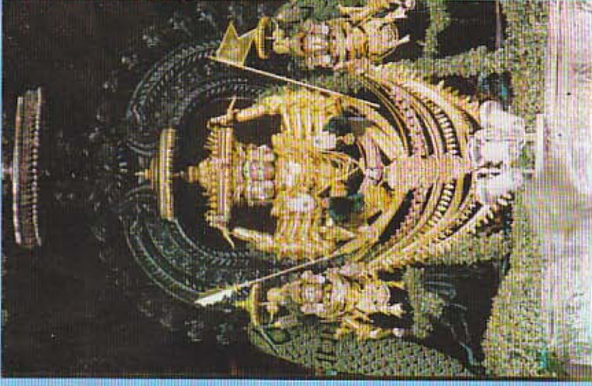
ஆறுமுகன் தேரால் இறங்கிவருகிறார்