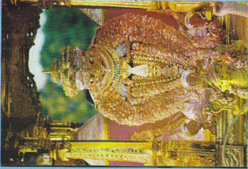
தங்கரதத்தில் தங்க வேலவன்