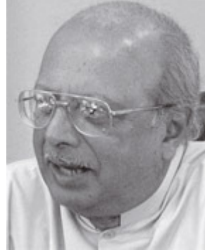
பேராசிரியர் திஸ்ஸ விதாரண