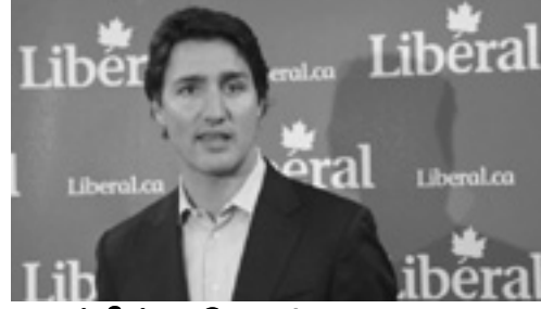
ஜஸ்டின் ருடோ (Justin Trudeau)

2015 ஒக்டோபர் 19ஆம் திகதி நடைபெற்ற கனடிய பாராளுமன்றத் தேர்தலில் மொத்தம் 338 ஆசனங்களில் 184 ஆசனங்களைக் கைப்பற்றி, லபரல் கட்சி (Liberal Party) ஆட்சி அமைத்துள்ளது. அக்கட்சியின் தலைவர் ஜஸ்டின் ருடோ - Justin Trudeau - (முன்னைய பிரதமர் பியரே