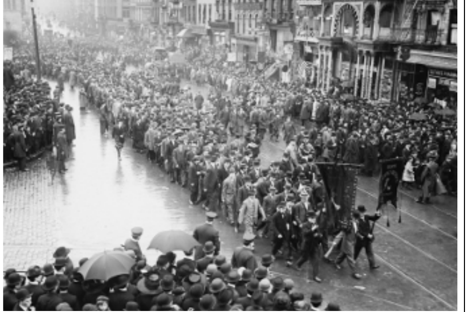
1909 ஆம் ஆண்டு நியூயோர்க் நகர மேதினப் பேரணி

சிக்காக்கோவில் நடந்த இந்தச் சம்பவங்கள் உலகம் முழுவதுமுள்ள தொழிலாளி வர்க்கத்தின் கோபத்தைக்