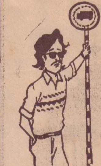
அப்ப... பிரிட்டன், தாய்வான் என்று லடாய் பட்டியல் நீரும் போலை...!

வரப்பட்ட 10 கோடி ரூபா பெறுமதியான ரொக்கட் மற்றும் மோட்டார் ஆயுதங்களை அண்மையில் ஸ்ரீலங்கா சுங்கத் திணைக்களம் பறிமுதல் செய்தது தெரிந்ததே. இந்நடவடிக்கையை எதிர்த்து தாய்வான் அரசு ஸ்ரீலங்கா அரசுமீது சர்வதேச நீதிமன்றில் வழக்குத் தொடர்ந்திருப்பதாக ஏஜென்சி செய்திகள் தெரிவித்தன. (9-7)