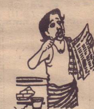
தேர்தல்களை மனச் சங்கீரணம் பிறகுதான், உணர்வுகளுக்கு அளம் பிறக்குதே போல...!

கிழக்கு மாகாணக் கரையோரப் பகுதியில் பாரிய இராணுவ நடவடிக்கைகளை ஆரம்பிக்கப்பட்டிருப்பதாக பிளிக் செய்தி. பாரிய இராணுவ நடவடிக்கைகளை ஆரம்பிக்கப்பட்டிருப்பதாக பிளிக் செய்தி. பாரிய இராணுவ நடவடிக்கைகளை ஆரம்பிக்கப்பட்டிருப்பதாக பிளிக் செய்தி. [9]