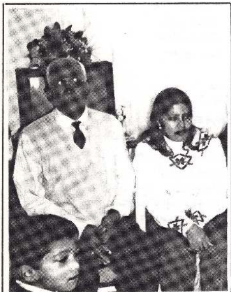
தன் ஒரே மருமகளுடன் எஸ். ஏ.