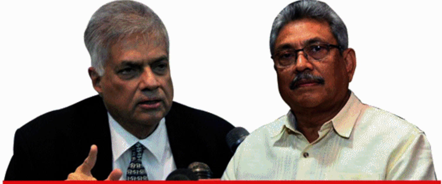
கொரோனாவை கட்டுப்படுத்தல், பொருளாதாரத்தை மேம்படுத்தல்...

பாராளுமன்ற பணியாட்தொகுதியினர் 12 பேர் கொரோனா தொற்றுக்கு உள்ளாகியுள்ளமை கண்டறியப்பட்டுள்ளதாக கம்பஹா மாவட்ட பாராளுமன்ற உறுப்பினர் விஜித் ஹேரத் தெரிவித்தார். பாராளுமன்ற வளாகத்தில் நேற்று (17) நடத்தப்பட்ட கொரோனா பரிசோதனைகளின் போதே அவர்கள் கொரோனாவால் பாதிக்கப்பட்டிருப்பது கண்டறியப்பட்டதாகத் தெரிவித்தார். கொரோனா நிர்வாகத்தில் இலங்கை சிறப்பாக செயற்படுவதாகச் சிலர் பெருமை பேசினாலும், இந்த நாட்டில் கொரோனா நிர்வாகம் தோல்வியடைந்து நீண்ட காலமாகிவிட்டது என்றும், தற்போதைய அரசாங்கத்துக்கு நாட்டை கட்டியெழுப்பும் தொலைதொகுக்கு பார்வை இல்லை என்றார்.