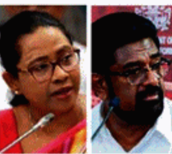
பக்கத்தில் இது குறித்து அவர் பதிவிட்டுள்ளார். அத்துடன், அமைச்சரவை மாற்றத்தில்

கொரோனா தொற்றுப் பரவலைக் கட்டுப்படுத்துவதில் முன்னர் சுகாதாரத் துறை அமைச்சர் பவித்ரா வன்னியராச்சி சிறப்பாகச் செயற்பட்டார் என தற்போதைய சுகாதாரத் துறை அமைச்சர் கெஹலிய ரம்புக்கவல புகழ்ந்துள்ளார். தனது ஓவீட்டர்