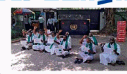
சங்கத்தினர் வந்து கலந்து கொண்டு ஆதரவளித்து வருகின்றனர். இந்தவகையில், கடந்த வாரம், தமிழகத்திலிருந்து காவிரி டெல்டா பாசன விவசாயிகள் சங்கத்தினர் டெல்லி வந்திருந்தனர். காவிரி டெல்டா பாசன

மத்திய அரசாங்கத்தின் முக்கிய மூன்று வேளாண் சட்டங்களை எதிர்த்து விவசாயிகள் டெல்லியில் போராட்டம் நடத்தி வருகின்றனர். இவர்களுக்கு ஆதரவாக பல்வேறு மாநிலங்களிலிருந்து விவசாய