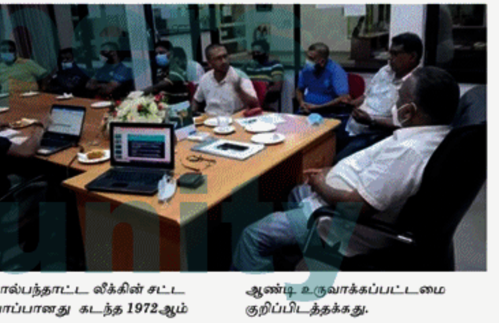
கால்பந்தாட்ட லீக்கின் சட்ட யாப்பானது கடந்த 1972ஆம் ஆண்டில் உருவாக்கப்பட்டமை குறிப்பிடத்தக்கது.