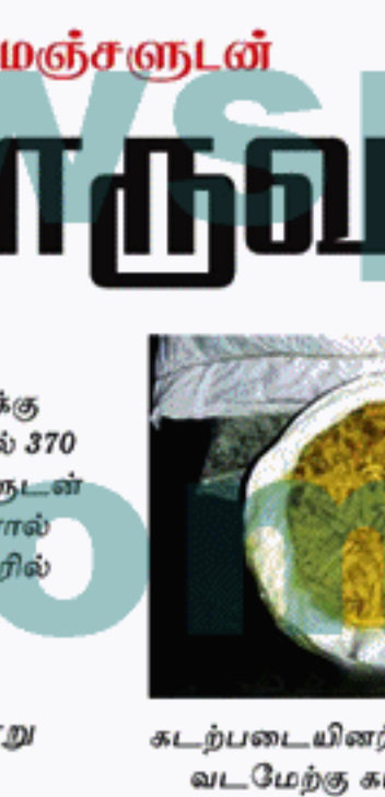
கடற்படையினர் தெரிவித்தனர். வடமேற்கு கடற்படை

கற்பிட்டி பொலிஸ் பிரிவுக்கு உட்பட்ட கிளித்தீவு பகுதியில் 370 கிலோகிராம் உலர்ந்த மஞ்சள்தூள் நபர் ஒருவர் கடற்படையினரால் நேற்று (17) சந்தேகத்தின் பேரில் கைது செய்யப்பட்டுள்ளார். கற்பிட்டி, முகத்துவாரம் பகுதியைச் சேர்ந்த 49 வயதுடைய ஒருவரே இவ்வாறு கைது செய்யப்பட்டுள்ளதாக