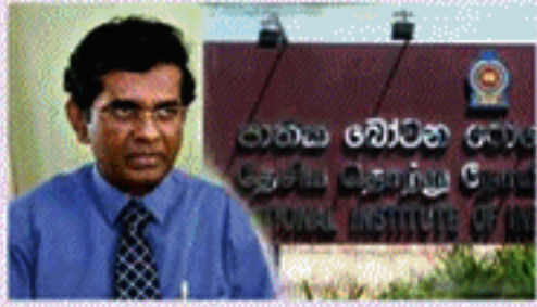
தெரிவித்துள்ளார். ஊடகவியாளர் எழுப்பிய