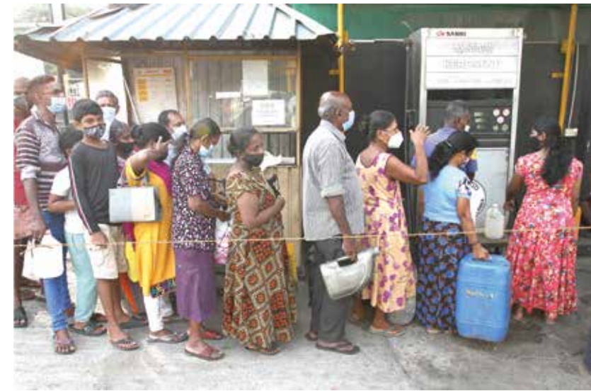
நாட்டில் மண்ணெண்ணெய்க்கு தட்டுப்பாடு நிலவுகின்ற நிலையில், அதனைப் பெற்றுக்கொள்வதற்காக கொழும்பு, ஓடுகொடவத்தையில் நீண்ட வரிசையில் நேற்று பொதுமக்கள் காத்திருந்தனர்.