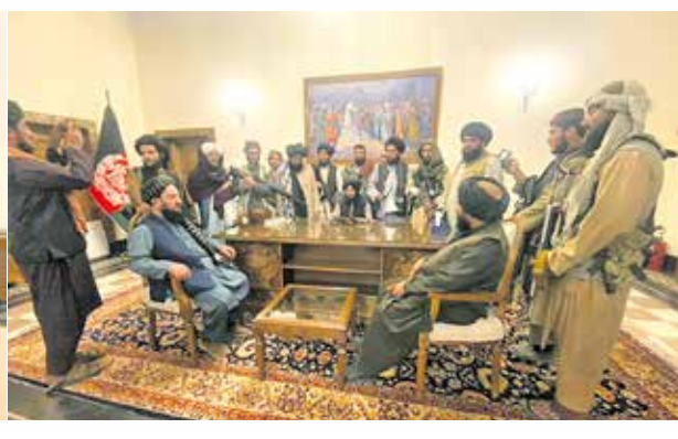
“இரத்தக்களியாக்க விரும்பவில்லை” - அஷ்ரப் கனி

இதனிடையே ஜனாதிபதி அஷ்ரப் கனி தனது பேஸ்புக் தளத்தில் பதிவிட்ட கருத்தில், “இப்போதிருந்து ஆப்கானிஸ்தானுக்கும், மக்களுக்கும் தலிபான்கள்தான் பொறுப்பு. மக்களின் மரியாதை, சொத்து, பாதுகாப்பு அனைத்துக்கும் தலிபான்கள் பொறுப்பேற்கவேண்டும்.