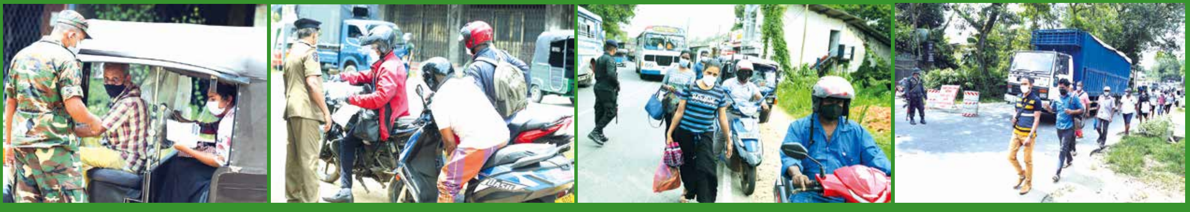
மாகாணங்களுக்கிடையில் பிரயாணத்தடை விதிக்கப்பட்டுள்ள நிலையில், சர்க்குமவ மாகாணத்திலிருந்து பஸ்களில் வருகை தரும் பயணிகள் இறங்கி, நேற்று நடைபயணமாக சென்றடைவதையும், மாகாண எல்லையில் வாசனங்கள் பரிசோதனைக்கு உட்படுத்தப்பட்டதையும் படங்களில் காணலாம்.

இச்சம்பவம் தொடர்பான விசாரணைகள் இடம்பெற்று வருவதாகவும், விசாரணைகளின் முடிவில் நீதிமன்ற நடவடிக்கை மேற்கொள்ளப்படவுள்ளதாகவும் பொலிவார் தெரிவித்துள்ளனர்.