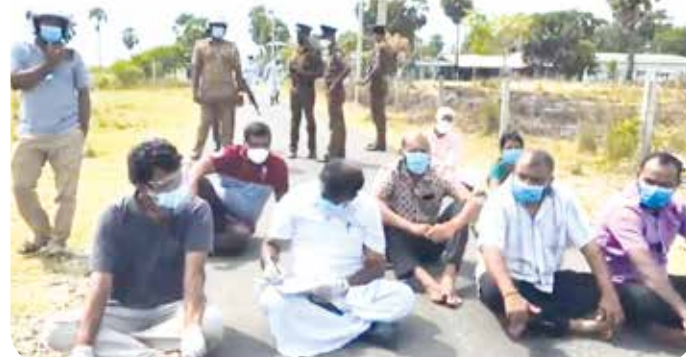
கடிதமொன்றை வழங்கினார். இதனைத் தொடர்ந்து நில அளவை

யாழ்ப்பாணம், பருத்தித்துறை பிரதேச செயலர் பிரிவுக்குட்பட்ட கற்கோவளம் இராணுவ முகாமுக்கென நான்கு ஏக்கர் தனியார் காணி சுவீகரிப்பதற்கான நடவடிக்கைக்கு எதிர்ப்புத் தெரிவித்து நேற்று போராட்டமொன்று முன்னெடுக்கப்பட்டது. இதன்போது நில அளவை மேற்கொள்ள வந்த நில அளவையாளர்கள் மற்றும் அதிகாரிகளை நில அளவை மேற்கொள்ள செல்லவிடாது வீதிக்கு குறுக்கே இருந்து தடுத்து நிறுத்தியதுடன், குறித்த காணிகளை இராணுவத்திற்கு வழங்க விடமாட்டோம்