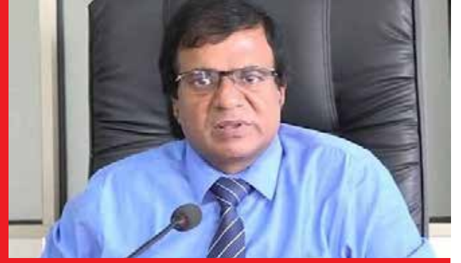
இதையடுத்து அவர் தனிமைப்படுத்தலுக்கு உட்படுத்தப்பட்டுள்ளார்.