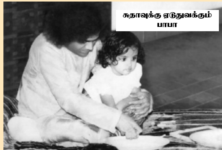
சுதாவுக்கு ஏடுதவக்கும் பாபா

வருகைதரும் பகவான் கலை நிகழ்ச்சிகள் நடை பெறுமானால் இரவு ஒன்பது மணிவரைகூட பிர சாந்தி நிலைய மண்டபத்தைவிட்டுச் செல்லமாட் டார். இறுதிவரை அங்கிருந்து அவற்றை ரசித்து கலைஞர்களைப் பாராட்டிவிட்டுத்தான் செல்வார். அவ்வேளைகளில் நாமும் அரிதாகக் கிடைக்கும் பகவான் தரிசனத்துக்காக நீண்டநேரம் அவர் விடை பெறும்வரை காத்திருப்போம். இத்தகைய கலாரசி