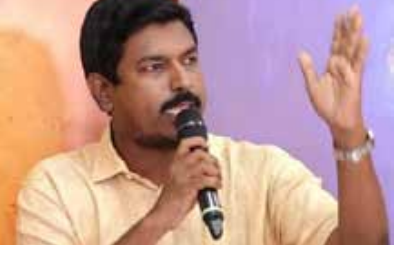
கள் எடுக்கப்பட வேண்டும்.

பொன்னாலைப் பகுதி மக்கள் இராணுவ வத்தினரின் வெறியாட்டத்தால் மிகவும் அச்ச உணர்விலே இருக்கின்றார்கள். இரா ணுவத்தினரின் இவ்வாறான மிலேச்சத்த னமான செயற்பாடுகளுக்கு நடவடிக்கை