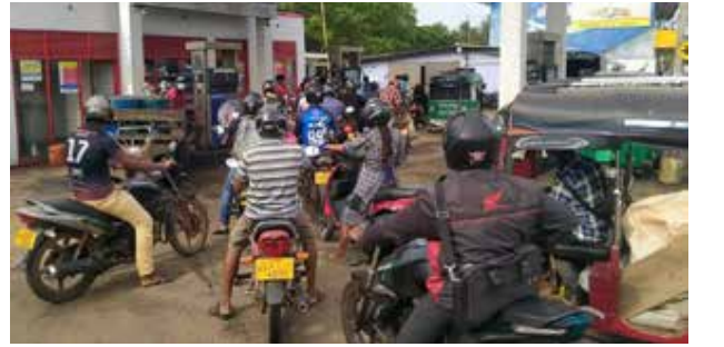
இருந்தது. அதேவேளை, வர்த்தக நிலையங்களிலும் மக்கள் அலை மோதினர்.

அதேநேரம், அண்மையில் நல்லூர் சுகாதார வைத்திய அதிகாரி பிரிவுக்குட்பட்ட கோண்டாவில் பகுதியில் பூப்புனித நீராட்டு விழா நிகழ்வில் பங்கேற்ற சிலருக்கு மேற்கொள்ளப்பட்ட பி.சி.ஆர். பரிசோதனையில் கொரோனாத் தொற்றுள்ளமை உறுதிப்படுத்தப்பட்டமை குறிப்பிடத்தக்கது.