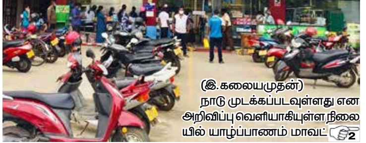
(இ.கலையமுதன்) நாடு முடக்கப்பட்டுள்ளது என அறிவிப்பு வெளியாகியுள்ள நிலையில் யாழ்ப்பாணம் மாவட்ட