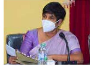
யர்கள் அனைவரிடமும் கேட்டுக்கொள்கிறேன் என்றும் தெரிவித்துள்ளார்.

மேலும், ஓட்சிசன் தட்டுப்பாடும் நிலவுகிறது. இவற்றைப் பெற்றுக்கொடுக்குமாறு வெளிநாட்டு வாழ் இலங்கை