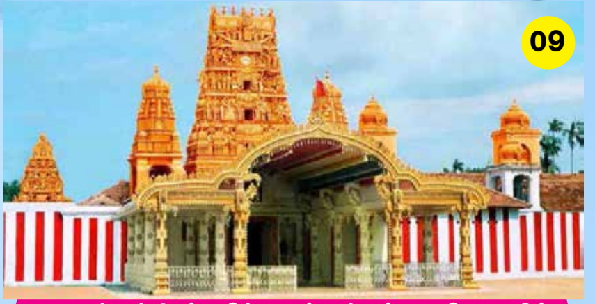
வரலாற்றுச் சிறப்பு மிக்க நல்லூர் கந்தசாமி கோவில் வருடாந்த உற்சவத்தையொட்டி 'காலைக்கதிர்' நடாத்தும்

வவுனியாவில் அண்மைய நாள் களாக தொற்றாளர்களின் எண்ணிக்கை அதிகரித்துச் செல்கின்றமையும் குறிப்பிடத்தக்கது.