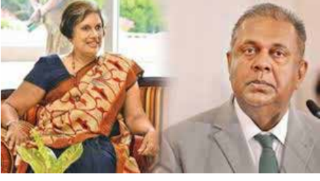
கொழும்பு, ஒக. 21

‘அன்புள்ள மங்கள, நம் நாட்டில் தற்போது அதிகளவிலான மக்களை பாதிக்கும் கொரோனா நோயால் நீங்கள் அமைதியாகிவந்தமை மிக வேதனையானது’ என முன்னாள் ஜனாதிபதி சந்திரிகா பண்டாரநாயக்க குமாரதுங்க தெரிவித்துள்ளார்.