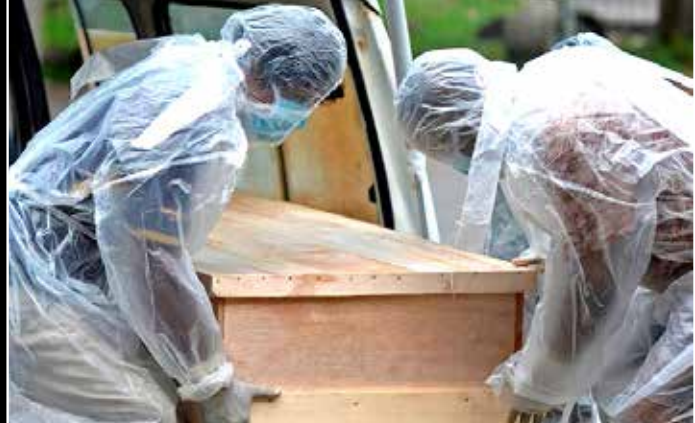
முன்தினம் உயிரிழந்தவர். இதன்மூலம் யாழ்ப்பாணம் மாவட்டத்தில்

யாழ்ப்பாணம், ஓக. 21 யாழ்ப்பாணத்தில் மேலும் 5 பேர் கொரோனா வைரஸ் தொற்றால் ஒரே நாளில் உயிரிழந்தனர். யாழ்ப்பாணம் போதனா வைத்தியசாலையில் சிகிச்சை பெற்று வந்த மானிப்பாய் சுதுமலை வடக்கைச் சேர்ந்த 92 வயதுடைய ஆண் ஒருவரும், கைதடியைச் சேர்ந்த 43 வயதுடைய ஆண் ஒருவரும், மானிப்பாயைச் சேர்ந்த 85 வயதுடைய ஆண் ஒருவரும், உரும்பிராயைச் சேர்ந்த 86 வயதுடைய ஆண் ஒருவரும், அளவெட்டியைச் சேர்ந்த 68 வயதுடைய பெண் ஒருவருமே நேற்று