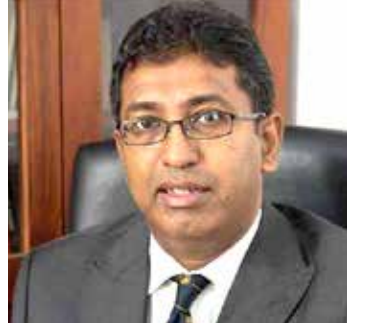
இதனால் பொருள்களின் விலையும் அதிகரிக்கும். இதிலும் மக்களே பாதிக்கப்படுவர்.

அத்துடன் அளவுக்கு அதிக மாக நாணயத்தாள்களை தொடர்ச்சியாக அச்சிடுவதால் பணவீக்கம் உயர்வடையும்.