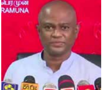
வரத்துத்துறை, பண்டப் போக்குவரத்து என்பவற்றை எடுத்துக்கொண்டால் அனைத்துத்துறைகளும் வீழ்ச்சியடைந்துள்ளன.

தொலர் பெறுமதியை அவ்வாறே அரசு பேணி வருகின்றது. எனினும், ஐந்து வருடங்களில் நாட்டின் பொருளாதாரம் அதேபோன்று நாட்டின் பாதுகாப்பைச் சீர்குலைத்ததுடன் அபிவிருத்தியடைந்த நாட்டை எமக்குக் கையளித்ததைப் போன்று இன்று வீதியில் இறங்கி பேரணி செல்கின்றனர். இது தொடர்பில் நான் எனது கண்டனத்தைத் தெரிவித்துக் கொள்கின்றேன். அதேபோன்று எதிர்க்கட்சியினர் தொடர்பில் நாட்டு மக்களும் நன்கறிவர். இன்று வரை நாட்டுக்கு வருமானத்தைத் தேடித்தந்த சகல வழிகளும் மூடப்பட்டுள்ளன. விசேடமாக சுற்றுலாத்துறையை எடுத்துக்கொண்டால் பூஜ்ஜியத்துக்கு விழுந்துள்ளது. அதேபோன்று வெளிநாட்டு வேலைவாய்ப்புகளால் எமது நாட்டுக்குப் பாரிய வருமானம் கிடைத்தது. எனினும், அந்த வருமானமும் மறைப்பெறுமதிக்குச் சென்றுள்ளது. ஆடைத்தொழிற்றுறை, உற்பத்தித்துறை, போக்கு